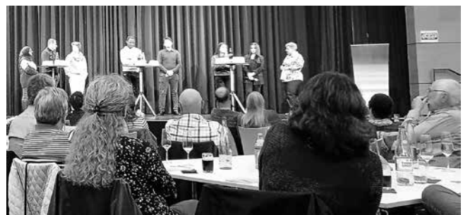
Geflüchtete Menschen aus dem Kreis berichten über ihre Erlebnisse und Erfahrungen