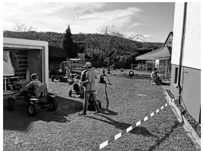
Gocart-Parcour im Garten der Volksmission.

Ganz herzlichen Dank an alle Mitarbeiter die sich rund um unseren Flohmarkt-Verpflegungsstand eingesetzt haben und damit aktiv zum Gelingen dieses Tages beitragen haben. Neu in diesem Jahr: unser Gocart-Parcour im Garten, der den ganzen Tag über sehr guten Anklang bei Kinder und Eltern gefunden hat.