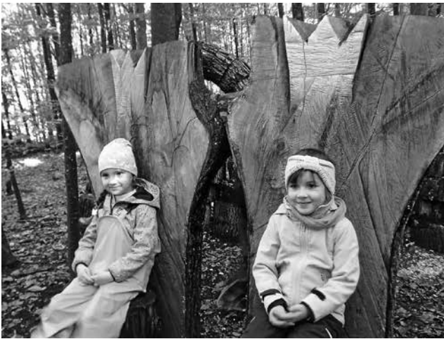
Prinzessinnen für einen Tag

Ein herzliches Dankeschön an unseren Elternbeirat und unsere Eltern, die uns diesen tollen Ausflug durch ihr großes Engagement ermöglichen.