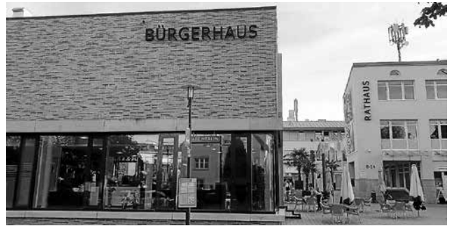
Das Bürgerhaus von Kernen war ein schöner Ort für unseren „Spätsommertreff“

Dass dieses Lied letzte Woche ausgerechnet von einem syrischen Sänger und Gitarristen zu hören war, berührte die Gäste im Kernener Bürgerhaus sehr. Das Landratsamt hatte dort zu einem „Spätsommertreff für ehrenamtlich Engagierte im Bereich Flucht und Migration“ eingeladen. Flüchtlingshelfer aus dem ganzen Kreis konnten sich dort untereinander über ihre Arbeit austauschen, aber auch mit den hauptamtlichen Sozialarbeitern und den für die Flüchtlingsbetreuung zuständigen Mitarbeitern im Landratsamt ins Gespräch kommen.