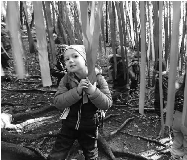
So schön hier!

Die verschiedenen Sinnesstationen regten zum Ausprobieren der eigenen Fähigkeiten an und auch der wunderschön gestaltete Spielplatz wurde ausgiebig erkundet. Viel zu schnell verging die Zeit! Mittags wartete der Bus an der Haltestelle auf uns, um uns wieder sicher zum Kindergarten zurückzubringen.