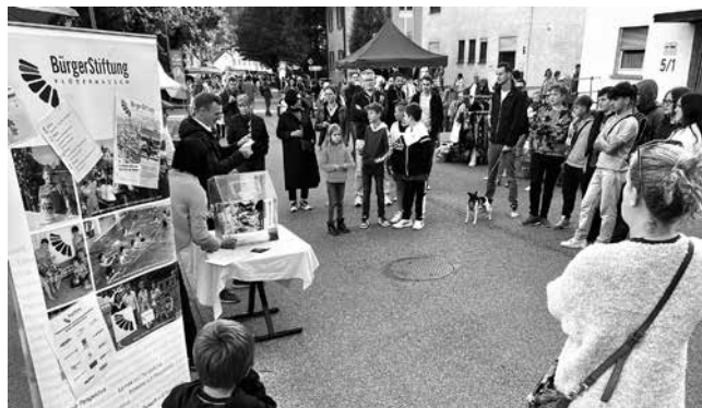
Gut besuchter Flohmarktstand