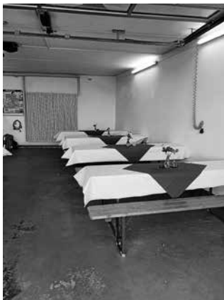
Noch hat der Ansturm nicht begonnen

Es war ein toller und erfolgreicher Flohmarkttag für den Ortsverein. Wir bedanken uns ganz herzlich bei allen Bürgerinnen und Bürgern die uns besucht und sich bei uns gestärkt haben. Ein ganz großes Dankeschön an alle unsere Helferinnen und Helfer von der Bereitschaft, dem JRK und von außen sowie Kuchenspendern, die uns an diesem Tag tatkräftig unterstützt haben.