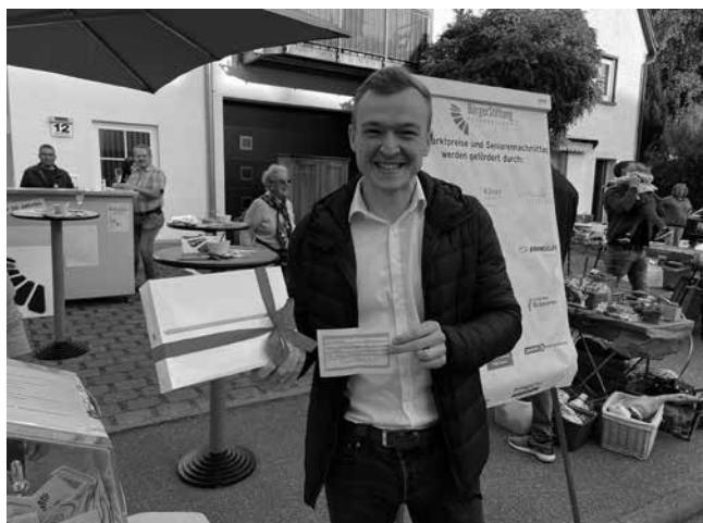
BM Treiber bei der Verlosung der Preise