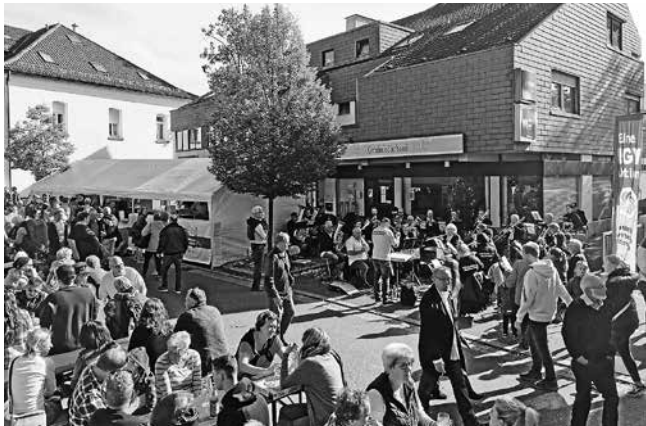
Flohmarkt-Panorama mitsamt Stand und Aktiver Kapelle

Volksbank für das zur Verfügung stellen der Strom- und Wasserinfrastruktur, Elektro Schmierer und nicht zuletzt der Gemeindebücherei sowie der evangelischen Kirchengemeinde, die uns Räumlichkeiten zum Lagern überließen.