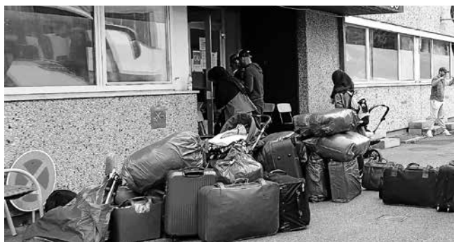
Die GU in der Birkenallee