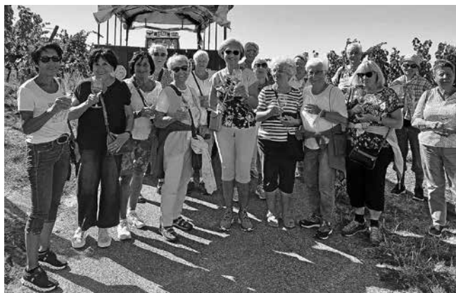
In den Weinbergen