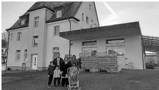
Die GU im Postweg