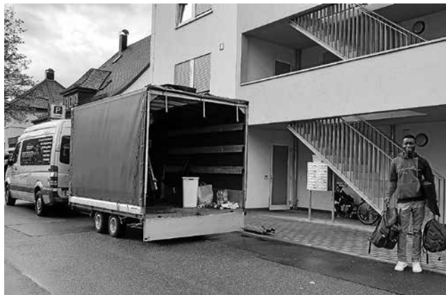
Die größte und neueste AU in der Schulstraße

Die vielen Geflüchteten, die täglich ankommen, müssen vom Kreis umgehend auf die Kommunen verteilt werden. Deshalb sind auch in Plüderhausen nicht nur die Gemeinschaftsunterkünfte des Kreises (GU), sondern auch die Anschlussunterkünfte der Gemeinde (AU) am Limit angekommen: Auch die anderen AU's der Gemeinde in der Boschstraße, Gmünder Straße und Adelberger Straße sind alle belegt.