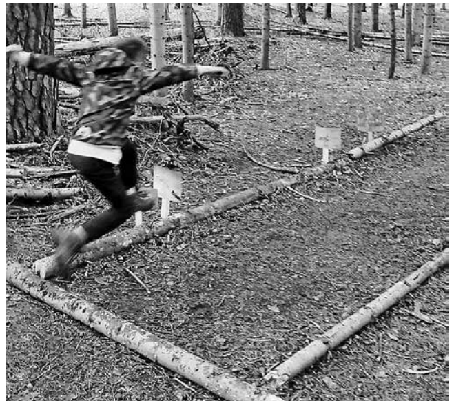
Der junge Mann gibt alles

Und wer am weitesten springen kann, konnte dies an der nächsten Station unter Beweis stellen...so weit wie eine Maus, ein Hase, ein Eichhörnchen oder sogar so weit wie ein Reh? Die Kinder gaben alles, wie man hier deutlich sehen kann!