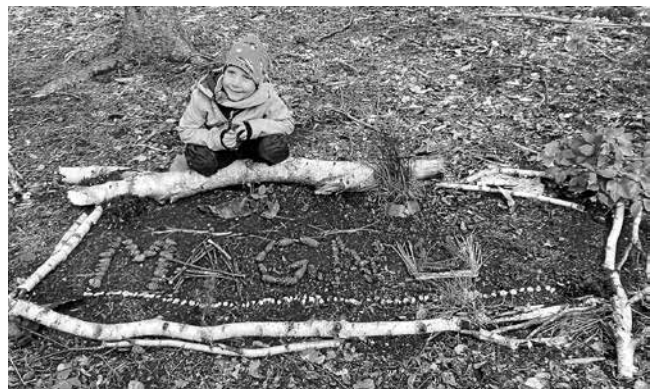
Stolz wird das entstandene Werk präsentiert

Was da entstand konnten die jeweils nächsten Familien bestaunen.