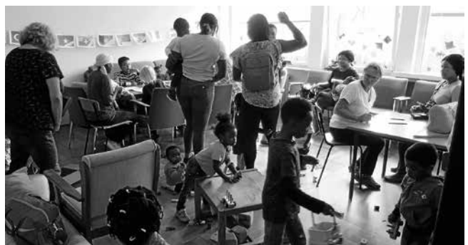
Das geht leider noch nicht!

Wie Sie auch letzte Woche in unserem Gemeindeblatt-Artikel wieder lesen konnten, bemühen sich unsere Mitarbeiter auch in Corona-Zeiten, die Geflüchteten in Plüderhausen zu unterstützen.