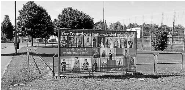
Plakat am Gänswasen

Mit einem Bauzaunbanner am Sportplatz machen wir auf den Restart aufmerksam und freuen uns, dass wir ab 14. Juni wieder proben können. Die Probe darf aber nur im Freien durchgeführt werden. Wir werden im Hof der Schloßgartenschule proben und hoffen auf gutes Wetter am 14. Juni und dass viele MusikerInnen dabei sind. Also entstaubt eure Instrumente. Wir freuen uns auf Euch!