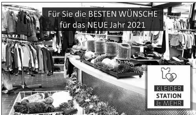
Willkommen im neuen Jahr