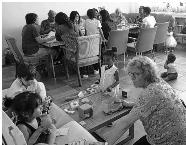
Diese Arbeitsatmosphäre in Vor-Pandemie-Zeiten wünschen wir uns bald zurück!

Die christlichen Kirchen haben als Jahreslosung für 2021 diesen Aufruf Jesu ausgewählt. Barmherzigkeit gehörte schon zu allen Zeiten zu den wertvollsten Tugenden, die ein Mensch haben kann. Aber sicherlich ist es gut, dass die Kirchen in einer so schwierigen Zeiten wie der unseren gegenwärtig wieder ganz besonders daran erinnern. Viele Menschen leiden unter der bedrohlichen Pandemie: die Infizierten, die Angehörigen der daran Verstorbenen, die in ihrer beruflichen und finanziellen Situation Bedrohten, die Alten und Einsamen. Und wenn wir auch alle jetzt mehr oder weniger unter den zahlreichen, aber notwendigen Einschränkungen unseres Lebens leiden, sollten wir doch besonders an die Menschen denken, die jetzt auf die „barmherzige“ Zuwendung ihrer Mitmenschen und des Staates ganz besonders angewiesen sind. Zu diesen Menschen gehören auch die Geflüchteten. Vor allem die, die während der Pandemie neu in die Gemeinschaftsunterkunft eines ihnen fremden Ortes eingewiesen wurden, leiden sehr unter ihrer Situation. Sie leben auf engstem Raum in einem Haus mit Betretungsverbot. Soziale Kontakte fehlen ihnen. Es dauert lange, bis sie endlich einen Schul- oder Arbeitsplatz gefunden haben - und in zahlreichen Fällen gelingt das gar nicht. Der Arbeitskreis Flüchtlingshilfe versucht, diese Menschen zu unterstützen. Wir hoffen, dass wir das nach einem Abklingen der Pandemie wieder mit der Nähe und Intensität tun können, die in unserer Arbeit bisher selbstverständlich dazu gehörte.