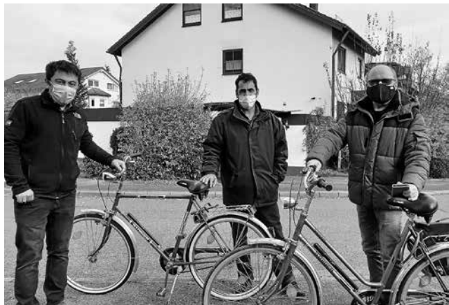
Zwei Familienväter aus Afghanistan freuen sich über ihr neues Rad.

Jeder, der auch nur ein bisschen Erfahrung mit dem Radfahren hat, kann Hemingway nur zustimmen. Land und Leute lassen sich beim Radfahren viel intensiver und direkter kennenlernen als beim Rasen über die Autobahn. Für aus fernen Ländern geflüchtete Menschen trifft das natürlich ganz besonders zu. Das Fahrrad ermöglicht ihnen, nicht nur die Umgebung ihrer Unterkunft zu erkunden, sondern auch die übrigen Ortsteile und auch die Nachbargemeinden und -städte. Und auch als Lastenesel für einen schweren Kartoffelsack und Getränke wird das Rad gerne eingesetzt. Ganz besonders wertvoll ist ein Fahrrad für solche Geflüchtete, deren Freunde und Familienangehörige in einem anderen Ort untergebracht sind. Gerade deshalb freuen sich auch die drei geflüchteten jungen Männer, die letzte Woche von Plüderhäuser Mitbürgern mit einem Fahrrad beschenkt wur-