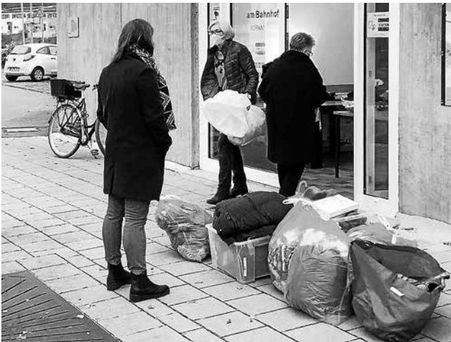
Warten vor der Abgabe der Kleiderspende