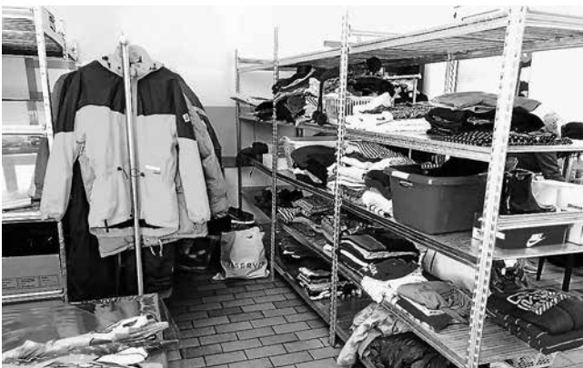
das Lager füllt sich