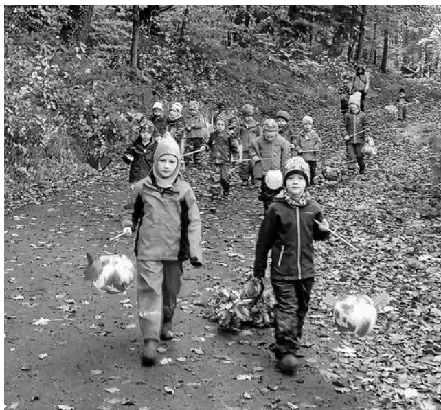
Laternenlauf bei Tag...