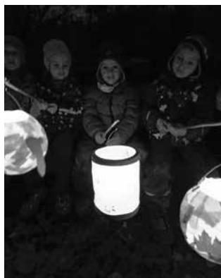
...und bei Nacht