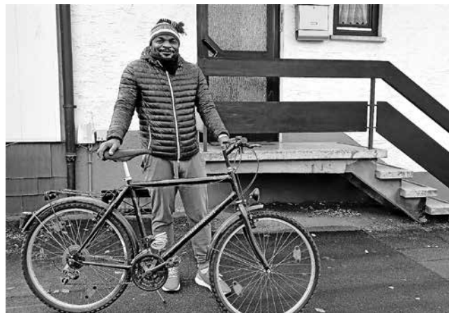
Der junge Mann aus Nigeria ist überglücklich, jetzt mit seinem neuen Rad seine Familie öfter sehen zu können.

den. Jetzt können sie mit ihren Familienangehörigen und Freunden mehr Kontakt halten, ohne viel Geld für öffentliche Verkehrsmittel ausgeben zu müssen.