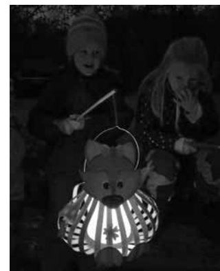
...mit selbst gebastelten Laternen