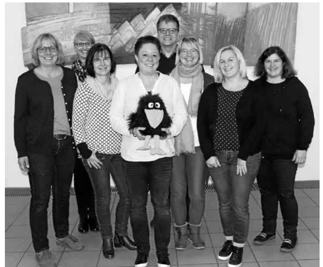
Das Team vom Gottesdienst für Kleine Leute (ohne Steffi)

Am letzten Sonntag hatte es unser Rabenmädchenkiki gar nicht leicht. Ganz empört berichtete sie vom Streit mit ihrem besten Freund Rudi. Da passte die Geschichte mit den Fizzli-Puzzlis und dem alten Stiefel wunderbar, denn bei ihr gab es viel zu lernen, wie man nach einem richtig schlimmen Streit wieder zusammenkommen kann. Wir freuen uns schon auf den nächsten Gottesdienst für Kleine Leute am 21. Juni - hoffentlich auf der Burghalde.