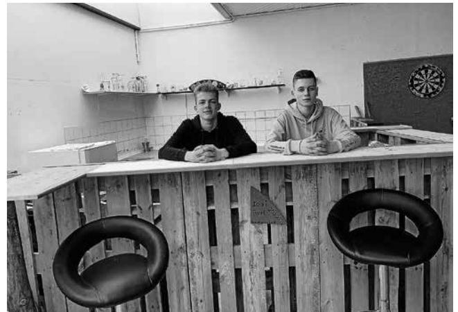
...und ihr Meisterstück