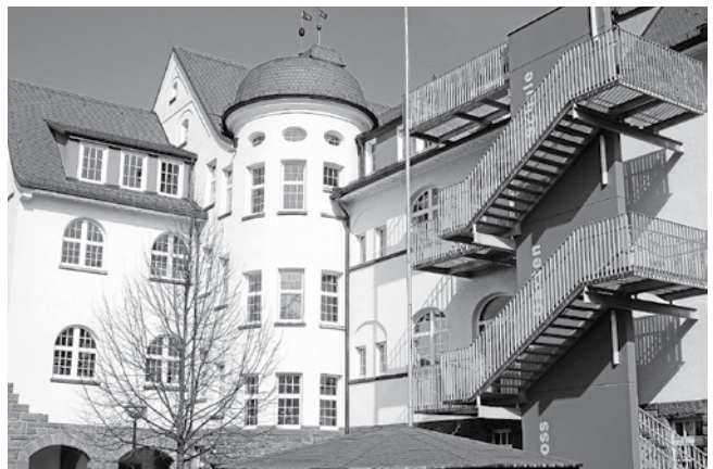
Ausführliche Informationen folgen in einer der nächsten Ausgaben

Seit der ersten Bürgerinformation im Dezember 2019 haben Gemeindeverwaltung, Gemeinderat und Schule weiter über die Schulzusammenlegung diskutiert. Bevor der Gemeinderat im April diesen Jahres eine Entscheidung über die Zukunft der Schlossgartenschule trifft, wird es eine erneute Bürgerinformationsveranstaltung geben. Hierzu möchten wir schon heute auf den Termin am Donnerstag, 26. März 2020, um 18.30 Uhr in der Mensa des Hohbergschulzentrums hinweisen.