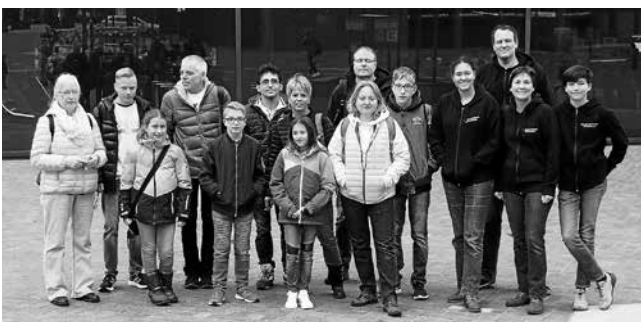
Vor der Experimenta

Der frühe Vogel fängt den Wurm und so ging es für 15 Jung- und Altfüchse nach Heilbronn zur Experimenta. Nachdem alle ihre Eintrittsbändchen hatten und die mitgebrachten Jacken und Rucksäcke in den großen Kleiderboxen verstaut hatten, ging es hoch in den 4. Stock zur großen Aktionsfläche.