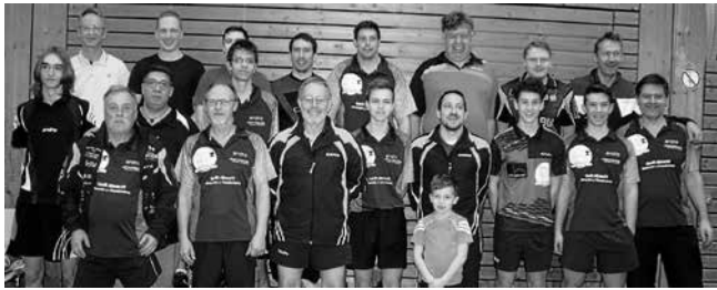
Teilnehmer Vereinsmeisterschaften