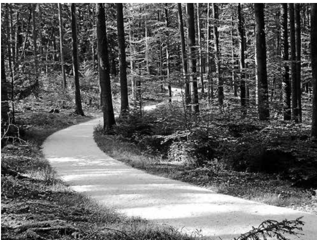
Film- und Infoabend „Wunderwerkwald - ein Jahr im Forstrevier“

Der Film vermittelt nicht nur Verständnis für die Menschen, die im und für den Wald arbeiten, sondern begeistert auch mit faszinierenden Details der Tier- und Pflanzenwelt. Die Schönheiten der Schöpfung wecken die Neugier des Betrachters und dienen als Anregung, selbst hinauszugehen, um das Wunderwerk Wald neu zu entdecken und dankbar zu bestaunen. Der Obst- und Gartenbauverein Plüderhausen e.V. zeigt den einstündigen Film und lädt seine Mitglieder sowie alle interessierten Mitbürger herzlich ein: