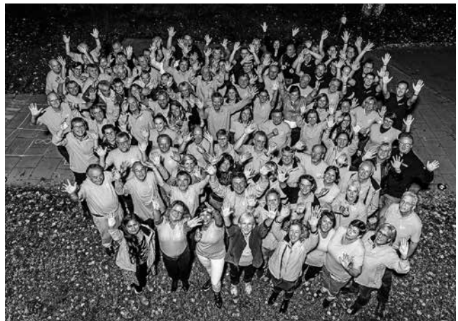
Ehrenamt mach Spaß!