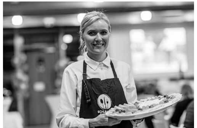
Es ist angerichtet für die Ehrenamtlichen