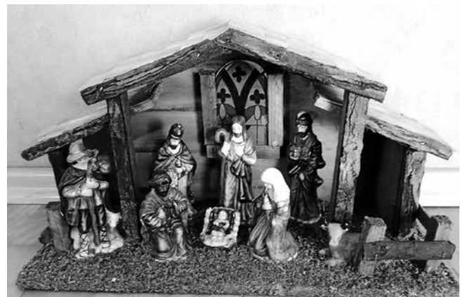
Vielfältige, interessante und unterschiedlichste Krippen und Figuren in verschiedenen Größen werden ausgestellt und verkauft.

Zugunsten der Comboni Missionare veranstaltet die Kirchengemeinde vom 01.11. -03.11.2019 eine Krippenausstellung im katholischen Gemeindehaus St. Michael, um das Missionsprojekt Ongata Rongai Convent in Nairobi, Kenia, zu unterstützen.