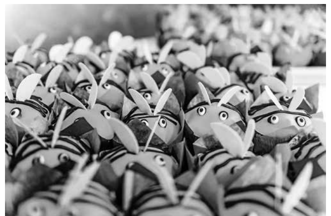
dekorativer Nachtisch: Ramsi-Muffins