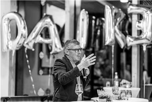
BM Schaffer: "DANKE in Großbuchstaben"