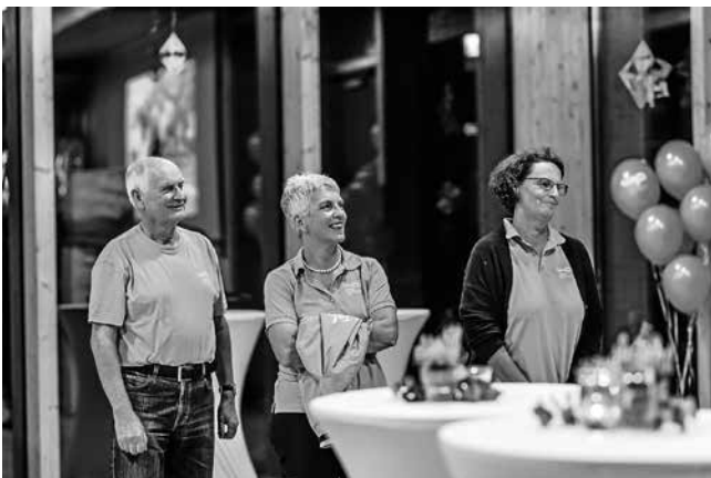
Vertreter von Theatersommer, REGA-Lenkungsteam und Gemeinderat