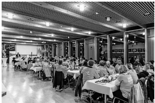
„Volles Haus“ in der Mensa