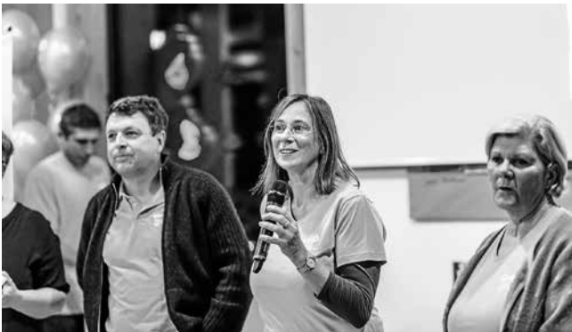
Interview mit Vertretern des Kunstwegs und des Bürgergartens