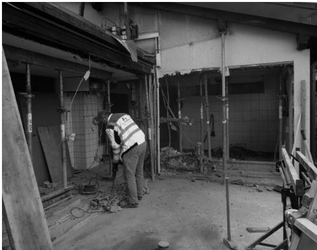
Start der Baumaßnahme mit dem Abbruch der alten Außenwände

Und zu guter Letzt wollen wir uns bei unseren Pächtern Gabi Küchle und Roland Przybilla recht herzlich für die gute Zusammenarbeit während der Bauphase und den Schwierigkeiten und Umplanungen kurz vor dem Baubeginn bedanken. Sie beteiligten sich nicht nur bei den Arbeitskosten des Fliesenlegers, sondern erwarben die neue Innenausstattung der Küche/ Spülküche auf ihre Kosten. Wir wünschen ihnen (und natürlich auch uns) weiterhin viel Erfolg mit der Schützenhausgaststätte und weiterhin guter Zusammenarbeit mit dem Verein.