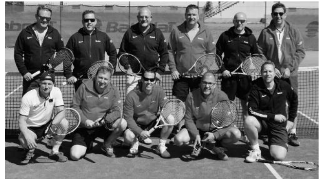
Tenniscamp Herren 40 in Pilsen

Jungs ... dann zeigt mal in der anstehenden Runde was ihr drauf habt!