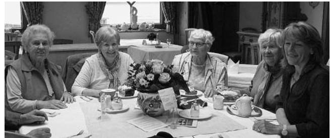
Eine fröhliche Kaffeerunde...

Mit Bedauern, dass die Zeit so schnell vergangen war, machte man sich auf den Heimweg, vorbei an blühenden Obstbäumen, üppigen Wiesen und gelb leuchtenden Rapsfeldern.