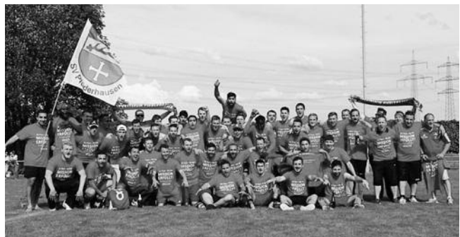
Der SVP hat die Doppelmeisterschaft sicher