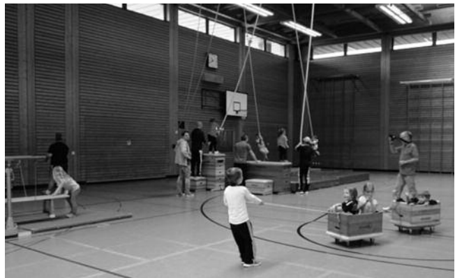
Spiel und Spaß in der Hohbergsporthalle