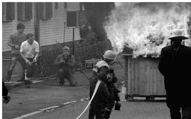
Historische Schauübung 2014: Schuppenbrand