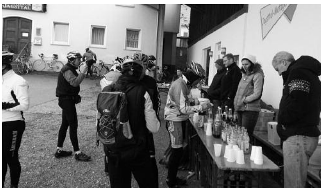
3. Verpflegungsstelle in Jagsthausen