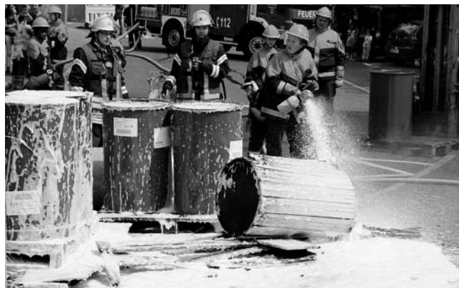
Shauübung 2015: Brennendes Faßlager

Der Tag der offenen Tür der Feuerwehr Plüderhausen steht kurz bevor. Traditionell zeigt die Jugendfeuerwehr Plüderhausen bei einer Schauübung ihr Können. Um 14 Uhr gibt die Sirene vom Rathausdach den Startschuß. Die Übung findet wieder direkt vor dem Feuerwehrhaus statt. Auch in diesem Jahr wird ein auf das Alter der Mitglieder abgestimmtes Übungsszenario einen kleinen Einblick in die vielfältigen Aufgaben der Feuerwehr geben. Seien Sie auch dieses Mal gespannt.