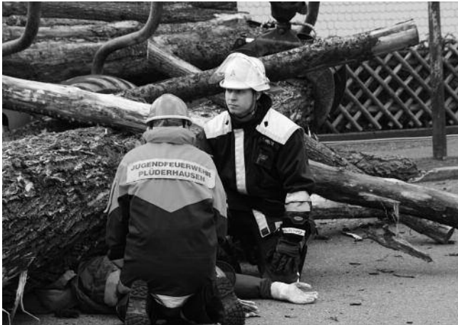
Schauübung 2012: Person unter Baum eingeklemmt

Die Jugendfeuerwehr freut sich auf viele große und kleine Besucher. Wie immer bietet die Feuerwehr vor und nach der Schauübung Fahrten für Kinder ab 3 Jahren (wir bitten um Beachtung und Verständnis). Für das leibliche Wohl ist natürlich an beiden Tagen wie immer gesorgt.