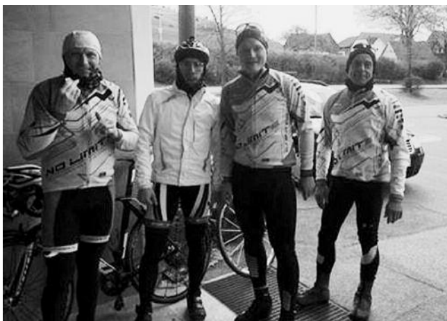
Der Wendepunkt am Ipf