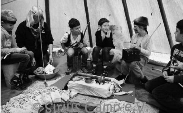
Das Geburtstagskind im Mittelpunkt

Ein Indianerstamm aus Urbach feierte letzten Donnerstag eine Geburtstagszeremonie im Camp.