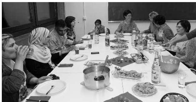
Die Runde der Genießer

Bald duftete es an jeder der vier Kochstellen anders verführerisch, und ein munteres Gespräch in vielen Sprachen durcheinander, mit Händen und Füßen und viel Gelächter war im Gange. Die gute Stimmung setzte sich beim gemeinsamen Essen nahtlos fort. Alle Gerichte haben köstlich geschmeckt und die Gespräche waren trotz aller Hürden anregend und informativ.