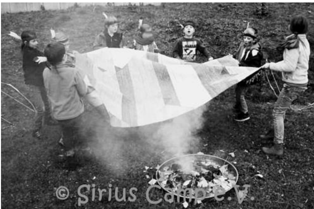
Rauchzeichen zu machen ist gar nicht so leicht.