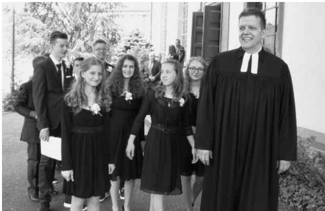
Entspannte Gesichter nach der Konfirmation Süd.

Am vergangenen Sonntag feierten wir die zweite Konfirmation in Plüderhausen.