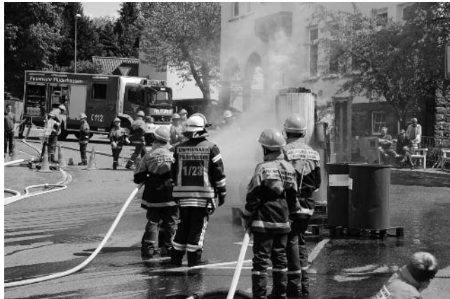
Feuer und Flamme sind die Mitglieder der Jugendfeuerwehr bei ihrer Schauübung.

Der Sonntag begann mit dem obligatorischen Frühschoppen und bereits kurz nach 11:00 Uhr waren die besten Plätze auf dem Hof vergriffen. Erneut einen Höhepunkt des Festes stellte die Schauübung der Jugendfeuerwehr dar. Auch in diesem Jahr zeigten die Jugendlichen ihr ganzes Können; dieses Mal beim Retten einer verletzten Person und dem Löschen mehrerer Fässer eines Klebstoffes, die bei Ver-ladearbeiten in Brand geraten waren. Nach der Übung spielten die Lokalmatadoren Masi & Jogse zur großen Freude und Unterhaltung der Gäste auf. Ebenfalls auf großes Interesse stießen wiederum auch die Rundfahrten mit den Feuerwehrfahrzeugen für die jüngeren Besucher.