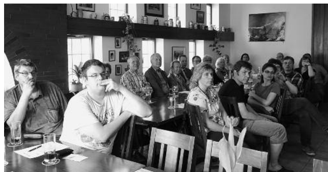
Aufmerksame Zuhörer bei der Generalversammlung