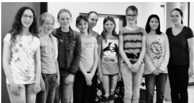
Hier ein Foto von „confetti grande“ bei der letzten Montag-Prob

Die beiden Chöre „confetti“ und „confetti grande“ proben bereits intensiv auf das bevorstehende Konzert der Sängervereinigung im Juni. Viele Proben stehen nicht mehr an, daher wird mit vollem Einsatz und konzentriert geübt.