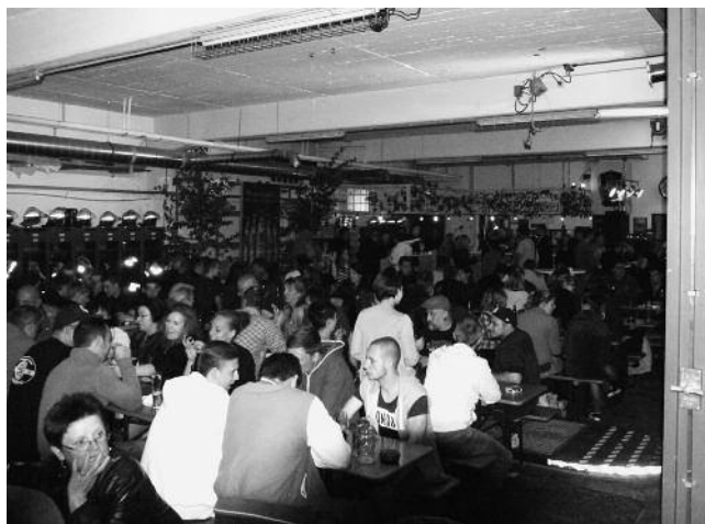
Die gut gefüllte Fahrzeughalle am Samstagabend.

Abgesehen von einem kurzen Gewitter beim Aufbau am Samstagmittag bescherte Petrus der Freiwilligen Feuerwehr Plüderhausen am vergangenen Wochenende bestes Festwetter. Ein interessantes Rahmenangebot sowie das bewährt gute Verpflegungsangebot taten ihr Übriges und sorgten daher für einen regen Zulauf beim traditionellen Tag der offenen Tür am Gerätehaus in der Schulstraße. Schon am frühen Samstagabend zum Festbeginn um 17:00 Uhr war der Hof vor dem Feuerwehrhaus gut gefüllt und in keinem der Stände wurde es einem der Helfer langweilig. Für die gute Stimmung und Unterhaltung sorgte am Abend wie in jedem Jahr eine Partyband. Bis in die frühen Morgenstunden wurde daher in der Fahrzeughalle getanzt und ge- feiert.