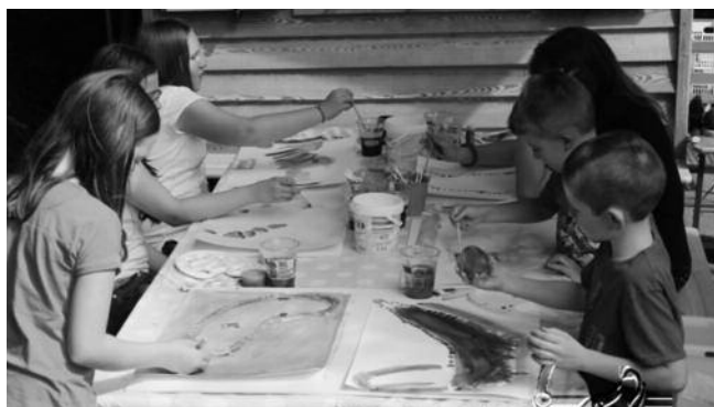
6 Künstler bei der Arbeit Zuerst entstand ein LandArt-Kunstwerk und später ein Aquarellbild davon

27.08.2015, LandArt und Aquarell (SFP Urbach)