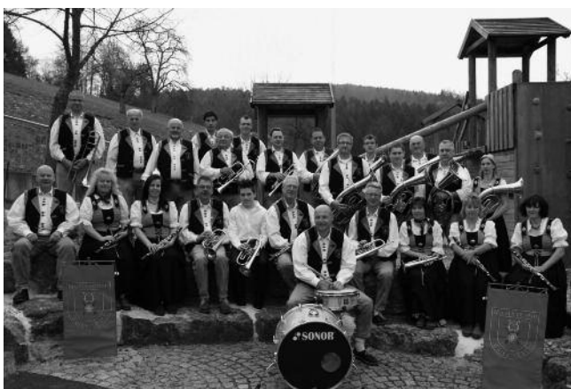
Unsere Kapelle im Jahr 2012