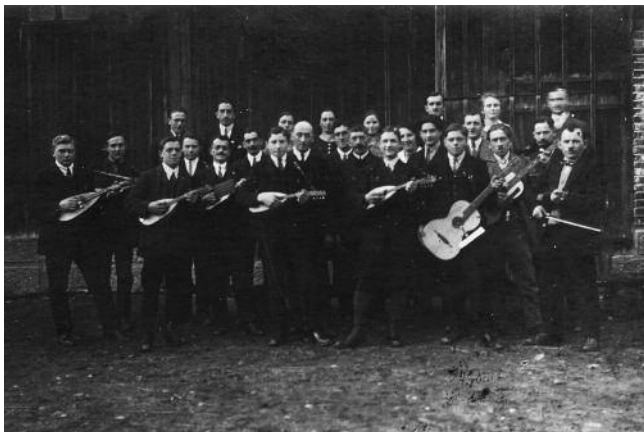
Wie 1925 alles begann ...

Das alles wäre ohne motivierte aktive Musiker, passive Mitglieder, eine kompetente Vorstandschaft und viele, viele Helfer und Spender nicht zu stemmen. An dieser Stelle an alle Beteiligten ein herzliches Dankeschön.