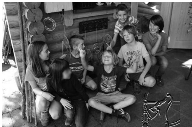
Die fröhlichen Besitzer eines eigenen Traumfängers

25.08.2015, Traumfänger basteln im Sirius Camp