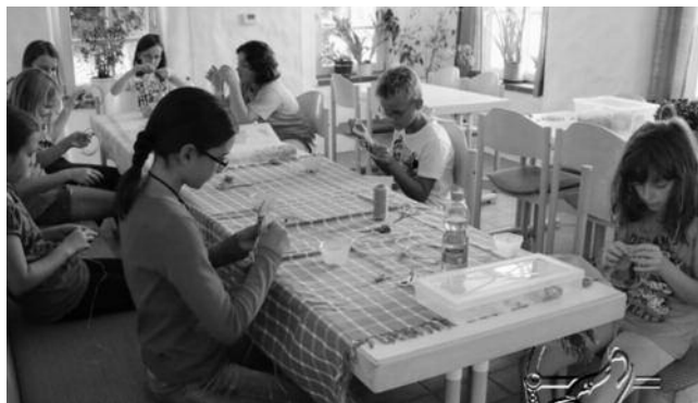
Diese Gruppe arbeitete 2 Stunden lang hoch konzentriert an ihren Traumfängern

02.09.2015, Traumfänger basteln (SFP Urbach)