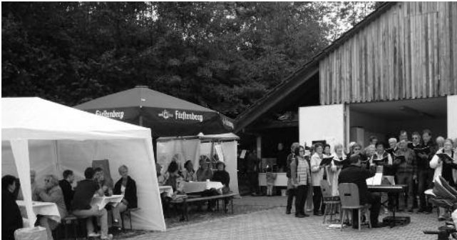
ein paar Eindrücke vom „Herbst am Reisersberg“

Dank an alle tüchtigen Helfer, die Aufbau, Abbau, Bewirtung, Abwasch, das ganze Drumherum sowie die schöne Dekoration wieder treu und bewährt in ihre Hände genommen haben.