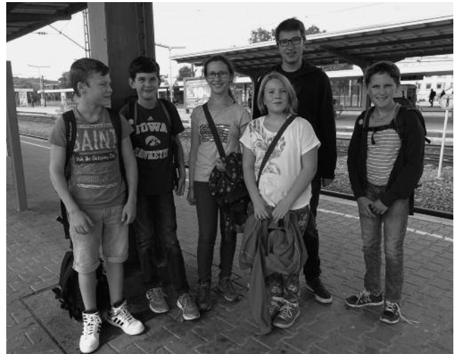
Das Radio-Team auf der Rückfahrt in Bad Cannstatt

Jan Henryk 'gefahren', d.h. er moderierte und bediente gleichzeitig die Technik und die Kinder lieferten voller Eifer ihre Einsätze. Zum Abschluss wurde noch ein Talk-Element aufgenommen. Die Kinder wurden gefragt, welche Spiele sie überhaupt nicht mögen und warum nicht, aber auch was sie an ihrem Lieblingsspiel besonders schätzen. Zum Schluss der Sendung waren alle vorgesehenen Punkte umgesetzt. Die Kinder konnten nicht glauben, dass die Sendestunde so schnell vergangen sein sollte. Es hat allen sehr gut gefallen und sie waren zu Recht auch stolz auf ihre Sendung. Zurück in Plüderhausen wurden wir von der Mutter eines Teilnehmers mit den Worten begrüßt: „Ihr habt eine tolle Sendung gemacht“.