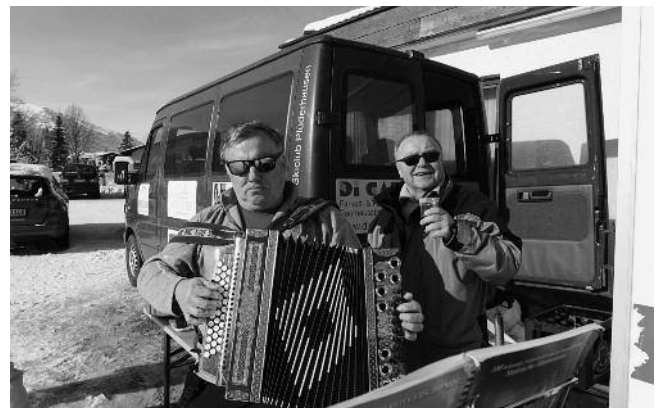
Mittagspause am Skibus