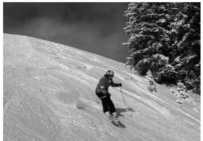
Leere Sonnenhänge mit Pulverschnee