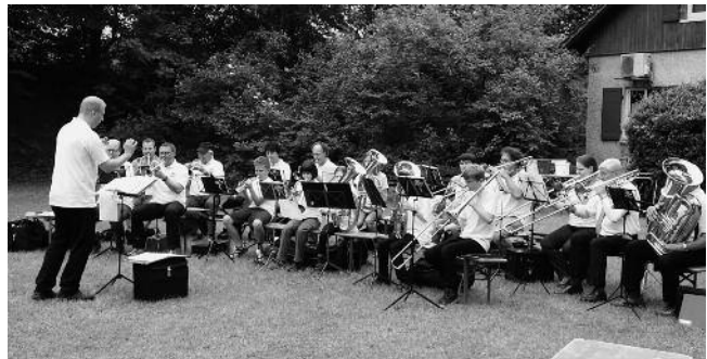
Der Posaunenchor umrahmte den Gottesdienst musikalisch in bewährter und dankenswerter Weise

Herzlichen Dank an alle Besucher und die fleißigen Helfer, sowohl bei der Landschaftspflege als auch beim Auf- und Abbau unseres Zelttes, sowie dem Versorgungsteam.