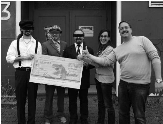
Spendenübergabe der Bandmitglieder für das Jugendhaus

Das inzwischen schon legendäre Konzert der Band Brechreiz am 2. Weihnachtsfeiertag im Jugendhaus in Plüderhausen, hatte dieses Jahr den ganz besonderen Nebeneffekt, dass die Bandmitglieder die Einnahmen dieses Konzerts dem Jugendhaus zu Gute kommen lassen wollten. Aus diesem Grund fand am Mittwoch, den 28.5.14 der Termin der Scheckübergabe statt. Die Jugendlichen und wir Mitarbeiter freuen uns sehr über die Spende von 400,- EUR und wollen sie zum Wohl der Besucher und des Jugendhauses verwenden. Vielen vielen Dank nochmals an dieser Stelle an die Band Brechreiz und ihrem Engagement für uns!!!