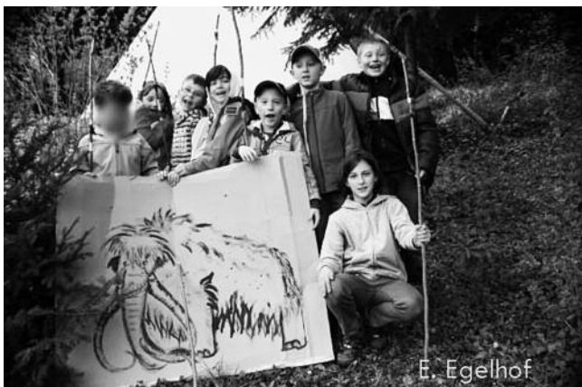
zurück im Lager

Später wurden Mammut-Würste am offenen Feuer an den Speeren gebraten.