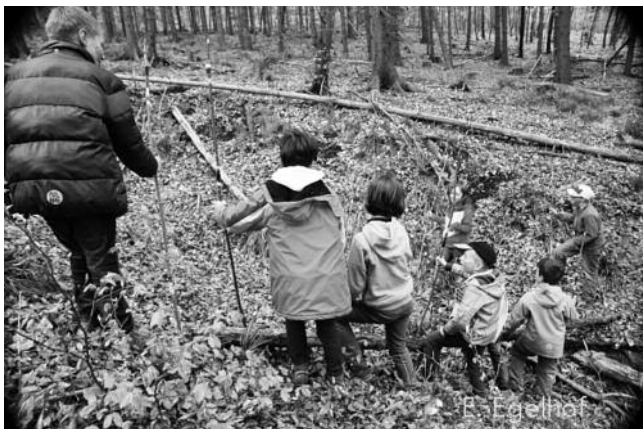
Der Mammut wird in die Enge getrieben

8 mutige Krieger reisten am Samstag, 05.04.2014 in die Steinzeit. Bewaffnet mit Speeren jagten sie gemeinsam einen Mammut.