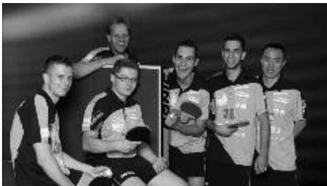
Das komplette SVP-Team für die neue Saison