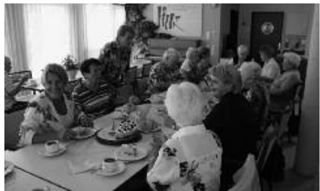
Fröhliche Gesichter in der Kaffeerunde.