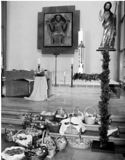
Die Osterspisen werden im Gottesdienst gesegnet