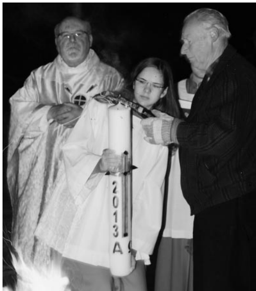
Die neue Osterkerze wird in der Osternacht angezündet