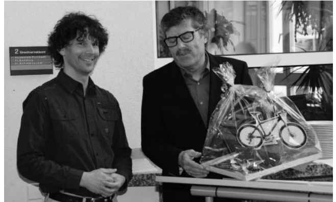
Dank und lobende Worte von BM Schaffer, der dem scheidenden Mitarbeiter einen kleinen Beitrag für sein Hobby - das Radfahren - übergab

Außerdem waren Sie ein glänzender Botschafter des Rathauses, der gut mit den Leuten konnte, dessen Kompetenz anerkannt war, der als netter, fröhlicher Mensch gesehen wurde und dem man vertraut hat“, stellte der Bürgermeister in seiner Abschiedsrede fest. Er sei sich stets sicher gewesen, dass nichts liegen bleibe, sich sein Mitarbeiter für die Sache einsetze und nach guten Lösungen suche.