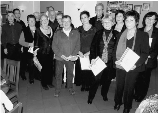
die Runde der Geehrten