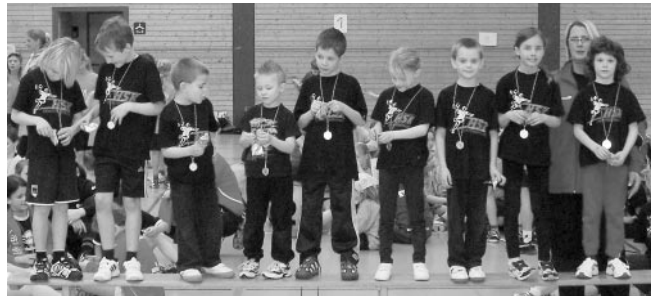
Minispielfest Mannschaft 2: