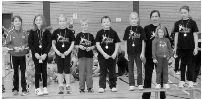
Minispielfest Mannschaft 1:

Training Gruppe Plüderhausen: Freitags von 16.45 - 17.45 Uhr