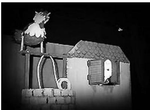
Erst der Brunnen - dann Frau Holle

Kartenvorverkauf ab sofort in der Gemeindebücherei.