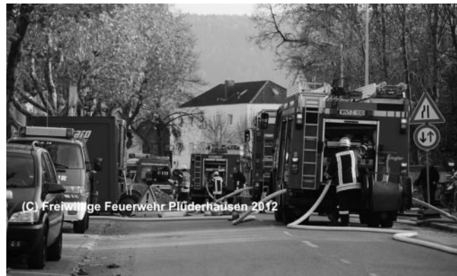
Die Fahrzeugaufstellung vor dem Gasthof Hirsch.