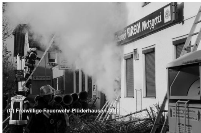
Menschenrettung und Brandbekämpfung über tragbare Leitern.