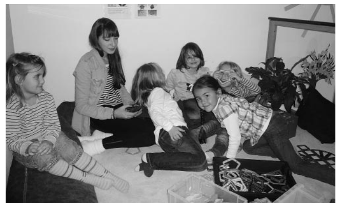
Nicht nur die Praktikantin war in Aktion beim „Aktionstag Berufswelt“, sondern auch die Kinder!

Am 15. 11. 2012 hatten zwei Schülerinnen aus Remshalden die Möglichkeit im Kinderhaus Goldacker ein Schnupperpraktikum zu absolvieren. Der „Aktionstag Berufswelt“ bietet Jugendlichen die Möglichkeit praktische Einblicke in Berufe zu erlangen und kann somit die Berufswahl erleichtern.