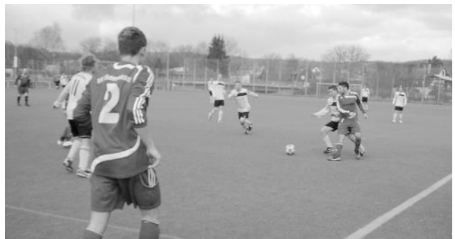
Der SVP war dem neuen Spitzenreiter unterlegen