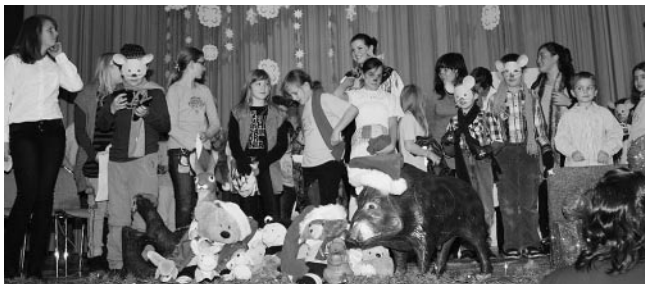
MVH-Jugend nach erfolgreichem Musicalauftritt