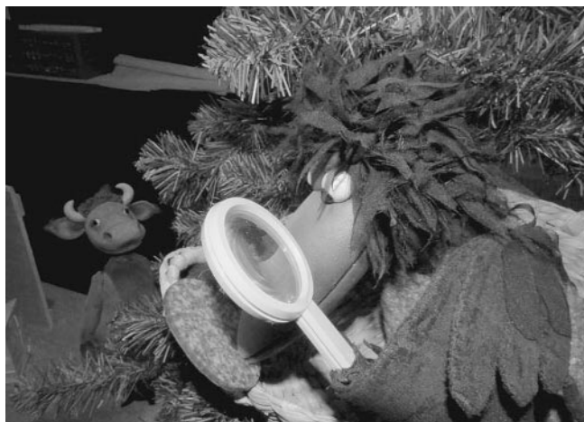
Krähe untersucht ihr Weihnachtsgeschenk auf Salamillen...