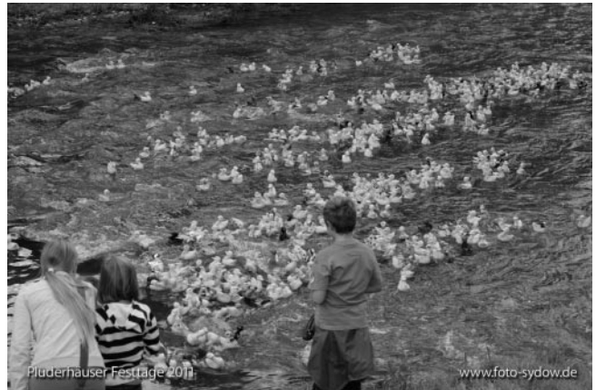
Schneller Start der Rentnenten....