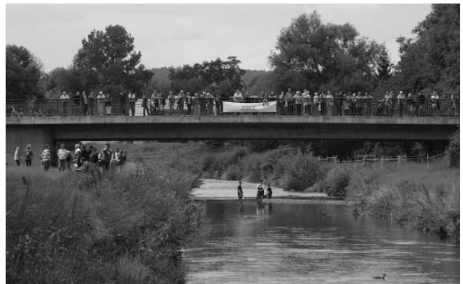
...und gespannte Zuschauer im Ziel