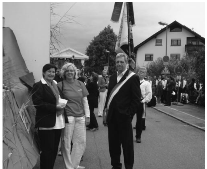
In Wartestellung vor dem Umzug

Unser Festwagen war wirklich schön und die Reaktionen beim Festzug durchweg positiv. Chapeau an den Gestalter des Festwagens und Dank an diejenigen, die beteiligt waren und tatkräftig mitgeholfen haben.