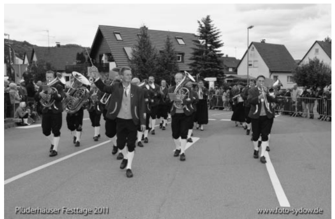
Der MV Hohberg an der Spitze des Festzugs...