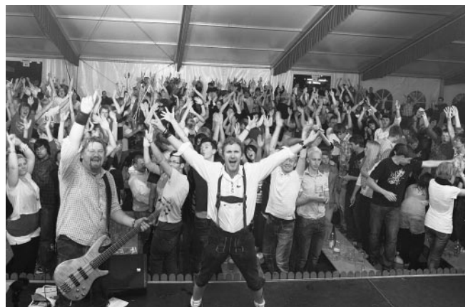
Hier glühen die Hände der W.I.P.S. und der tobenden Menge