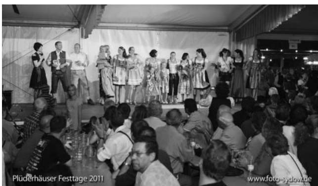
„Meine Tracht“ Backnang und knackige Trachtenmode