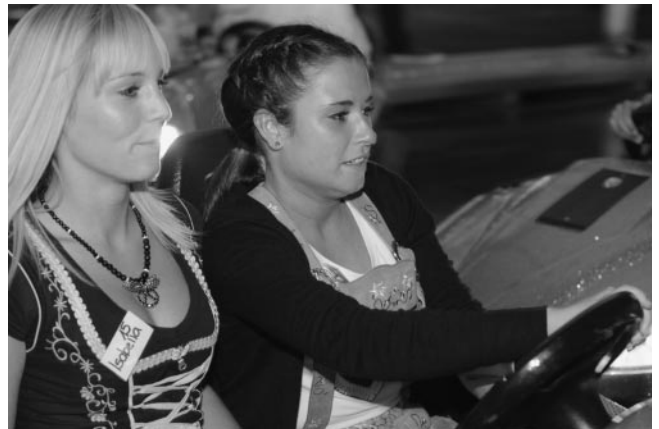
Ups, gleich gibt's einen Crash...