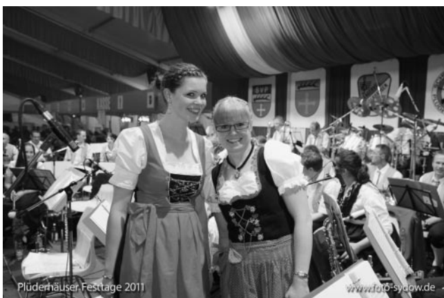
Der MV Hohberg präsentierte sich von seiner schönsten Seite