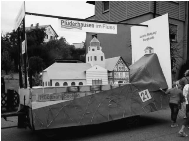
Unser Festwagen mit dem Rückhaltebecken.

Die Sängervereinigung bedankt sich bei allen, die unseren Festwagen auf den zweiten Platz (mit nur einer Stimme Differenz zum 1. Platz) gewählt haben. Wir sind mit einem großen Foto von unserem Festwagen in der Schorndorfer Zeitung vom Montag vertreten und freuen uns darüber.