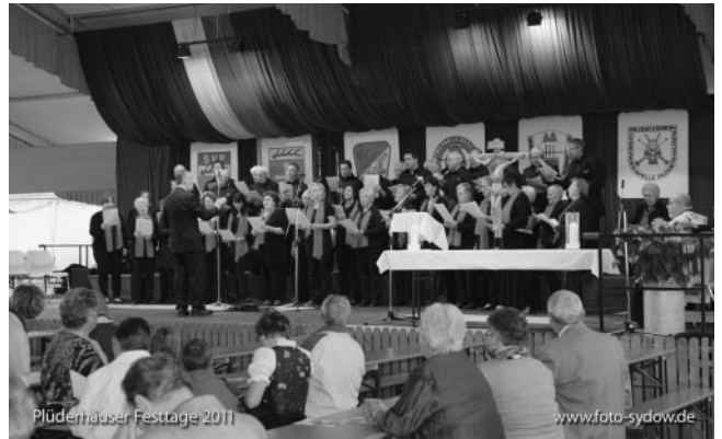
Festgottesdienst am Sonntagmorgen