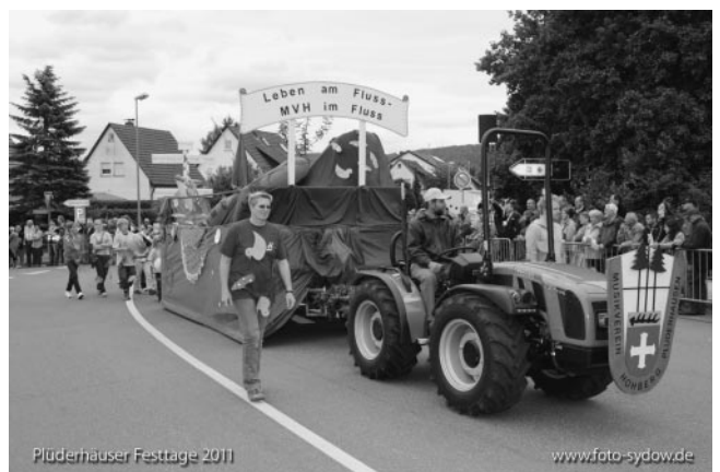
...der Wagen des MV Hohberg...