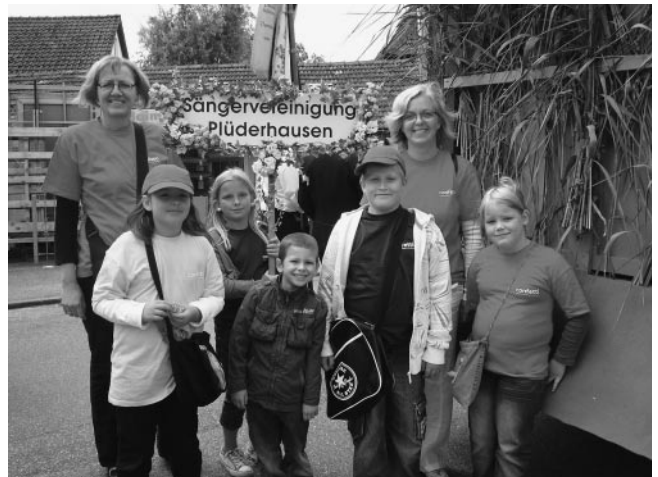
Einige unserer confetti Kinder freuen sich schon auf den Umzug.

Es sind Sommerferien und wir wünschen allen confetti Kindern eine wunderschöne Ferienzeit mit gutem Badewetter und tollen Erlebnissen.