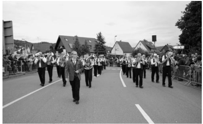
Der MV Gemeindekapelle