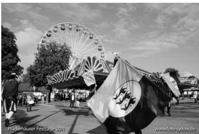
Auftakt mit den Fahnschwingern aus Sulzbach...