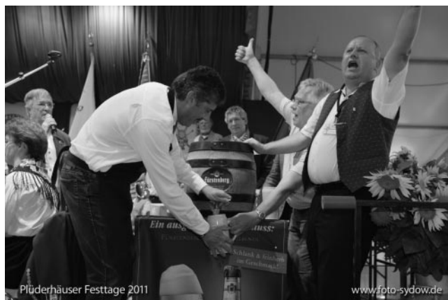
Mit nur 4 Schlägen ist er drin, der Zapfhahn!