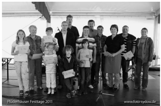
Die glücklichen Gewinner des Entenrennens