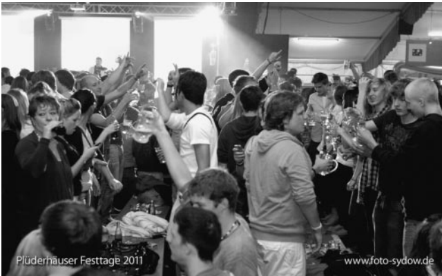
...und die Menge ebenfalls