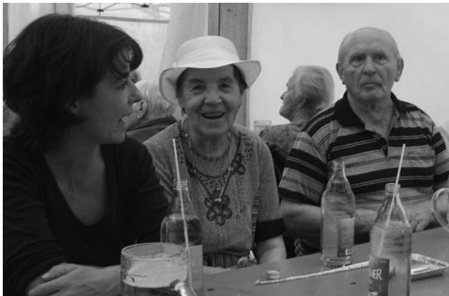
Wir warten noch auf unsere Festwurst...

Bei bunter Unterhaltung durch das Kreissenorenblasorchester Ostalb mundeten Festwurst und Getränk besonders gut. Zwei Stunden dauerte der Besuch am Festmontag, bei dem oftmals alte Bekannte an den Tischen auftauchten, sehr zur Freude der Ausflügler.