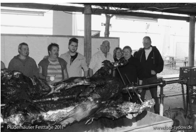
Der Festochse und seine Betreuer