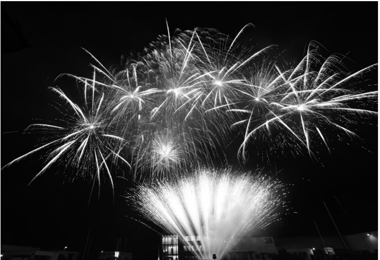
Funkenmeer am Nachthimmel