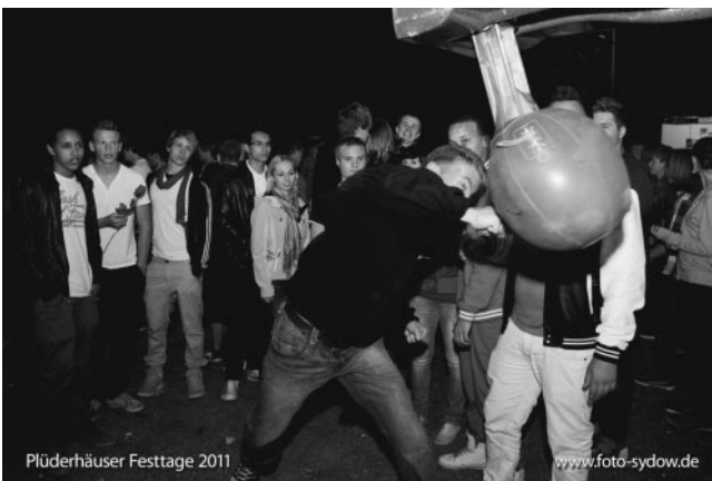
Saures auf dem Rummelplatz