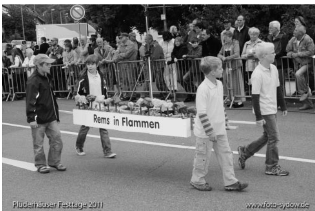
...und der Beitrag der Plüderhäuser Musikanten