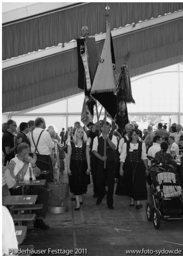
Einzug der Festbeteiligten