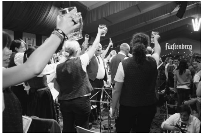
„Die Krüge hoch!“