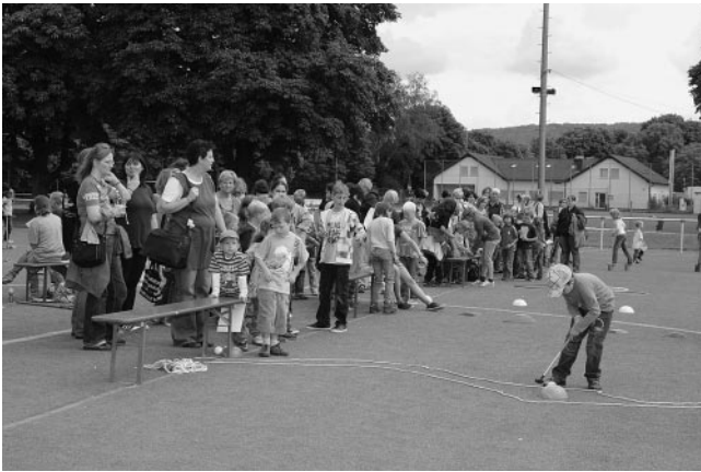
...Spiele-Spaß auf dem Sportplatz.