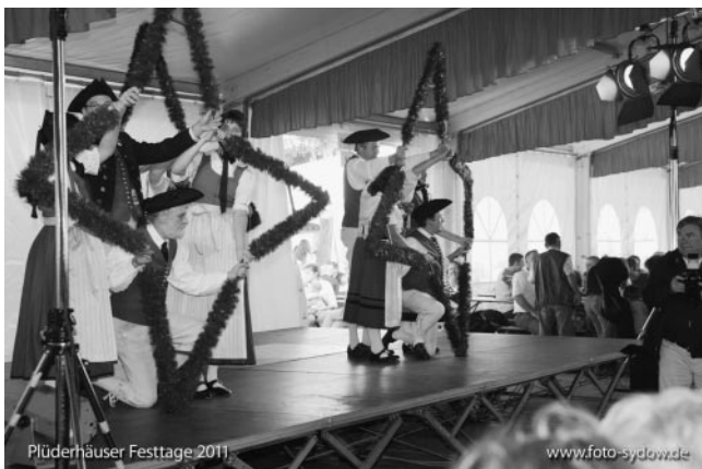
Sternentanz der Trachtengruppen Gschwend und Schorndorf