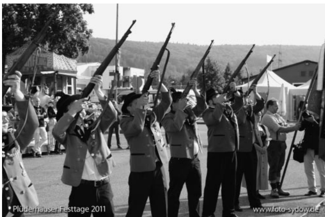
...bevor die Schützen das Eröffnungssalut schießen