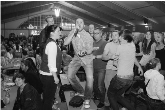
„Da geht noch mehr!“ Done von der Gemeindekapelle