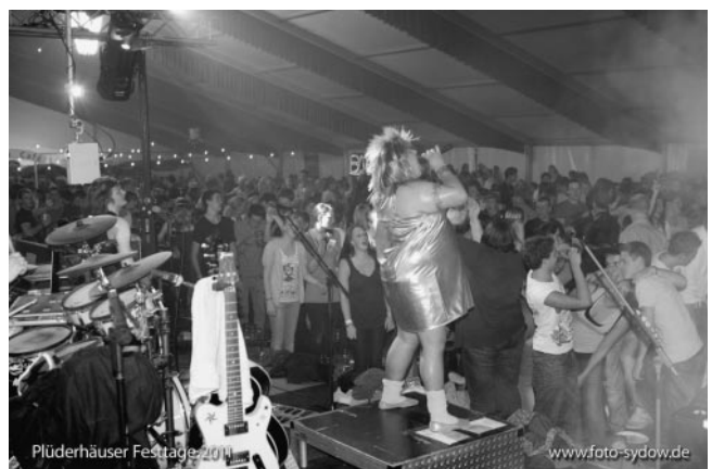
AllgäuPower macht Dampf...