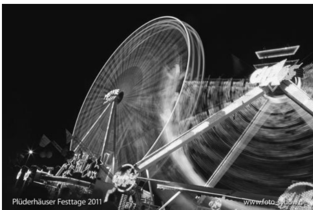
Der bewegte Vergnügungspark