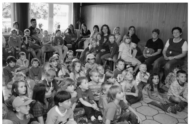
Spannung beim Kaspertheater...