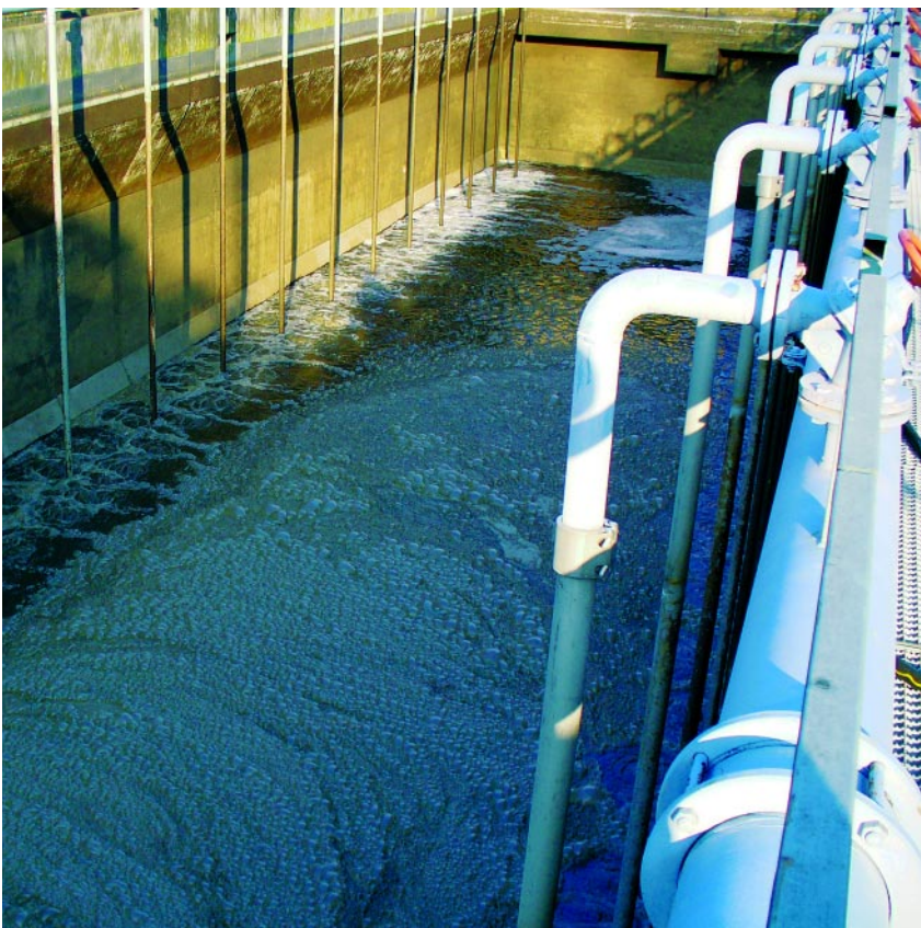
Die Belüftungskerzen beim Einbau Einstellen des sogenannten 'Sprudelbildes'