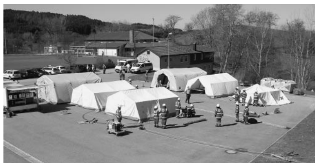
Beim Aufbau der „Zeltstadt“

Nach ca. 2,5 Stunden Fahrt erreichten dann die beiden Einheiten die Einsatzstelle. Dort wurde unverzüglich damit begonnen die Sporthalle in einen Notunterkunft umzugestalten. Es wurde mehrere Bereiche eingerichtet um Platz für z.B. einen Speisesaal, Bereich für Eltern mit Kindern, zum Spielen, einer Sanitätsstation und einer Essensausgabe zu schaffen. Da es sich um eine Sporthalle handelte, waren genügend Sanitär-einrichtungen vorhanden. Da die Halle zur Einrichtung von Schlafmöglichkeiten für alle zu klein war, wurde parallel zu den Maßnahmen in der Halle damit begonnen im Außenbereich eine Zeltstadt zu errichten. Zelte wur-