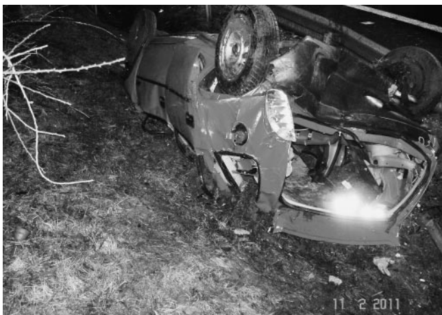
Der stark deformierte Unfallwagen nach den abgeschlossenen Rettungsmaßnahmen

Ein ausdrückliches Lob geht an dieser Stelle nochmals an alle eingesetzten Einsatzkräfte von Feuerwehr, Rettungsdienst und Polizei für die sehr gute, schnelle und professionelle Zusammenarbeit.