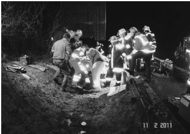
Rettung der eingeschlossenen Person durch die Feuerwehr und den Rettungsdienst

Kurze Zeit später konnte die verletzte Person mittels einer Schaufeltrage aus dem Fahrzeug gerettet und zur weiteren Betreuung an den Rettungsdienst übergeben werden. Im weiteren Verlauf des Einsatzes übernahm die Feuerwehr Plüderhausen noch das Ausleuchten der Einsatzstelle für die polizeiliche Unfallaufnahme.