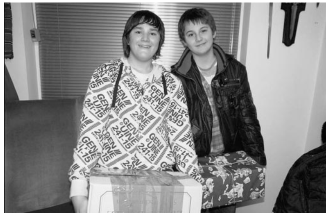
2 osteuropäische Kinder zeigen voller Stolz und Dankbarkeit ihre soeben erhaltenen Geschenkpakete

Insgesamt wurden in diesem Jahr 11.000 Weihnachtspäckchen fast ausschließlich aus Baden Württemberg gespendet und in die Länder Rumänien, Bulgarien, Lettland, Kaliningrad, Ukraine, Ungarn und Weissrussland transportiert.