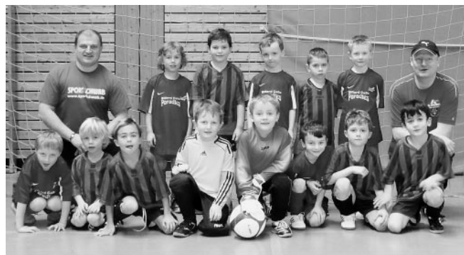
Unsere Bambinis beim Hallenturnier

Am Wochenende wurde in der Hohberghalle ein Bezirksspieltag durchgeführt. Am Samstag spielten 17 Bambini-Mannschaften aus dem Rems-Murr-Kreis um Punkte und Tore. Die Kinder im Alter von 5 und 6 Jahren zeigten dabei ein großes Kämpferherz. Die F-Junioren (7 und 8 Jahre alt) waren am Sonntag im Einsatz. 19 Mannschaften gaben dabei ihr Bestes und brillierten teilweise mit schönen Spielzügen. Die Teams des SVP nahmen mit durchschnittlichem Erfolg am Turnier teil, es gab sowohl Siege als auch ein paar Niederlagen. An beiden Tagen kamen zahlreiche Zuschauer zu uns in die Halle um die Kinder bei ihrem Sport entsprechend zu unterstützen. Wir bedanken uns bei allen Helfern, die zu einer rundum gelungenen Veranstaltung beigetragen haben.