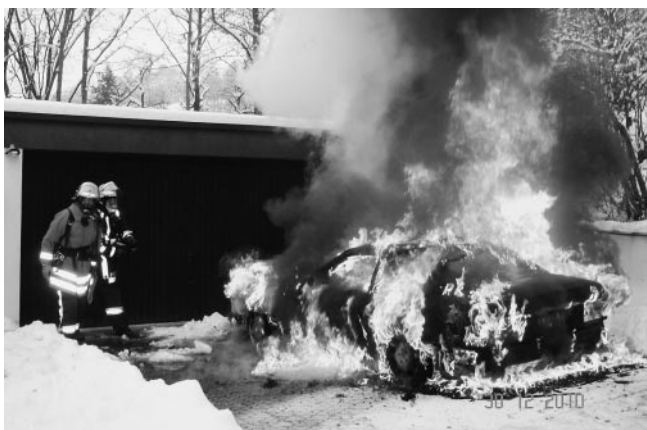
Fahrzeug im Vollbrand in der Hofeinfahrt vor der Garage.

Auch hierzu konnte bereits kurze Zeit später das erste Fahrzeug zur Einsatzstelle abrücken. Bereits auf der Anfahrt zum Einsatzort war eine starke Rauchentwicklung sichtbar. Aufgrund der zu diesem Zeitpunkt noch unklaren Lage wurden vom Einsatzleiter weitere Kräfte zur Unterstützung nachgefordert. Beim Eintreffen der ersten Einsatzkräfte stand das Fahrzeug in einer Hofeinfahrt bereits im Vollbrand. Sofort wurde unter Atemschutz mit der Brandbekämpfung begonnen. Mit dem Einsatz von Löschschaum konnte das Fahrzeug gelöscht werden. Trotz des schnellen Eingreifens der Feuerwehr brannte das Fahrzeug vollständig aus. Aufgrund der örtlichen Lage und der schlechten Wasserversorgung in diesem Bereich war die Freiwillige Feuerwehr Plüderhausen mit allen drei wasserführenden Löschfahrzeugen und 30 Mann im Einsatz.