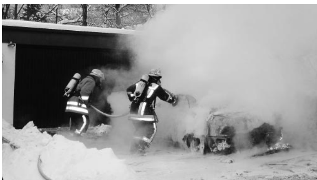
Brandbekämpfung unter Atemschutz.