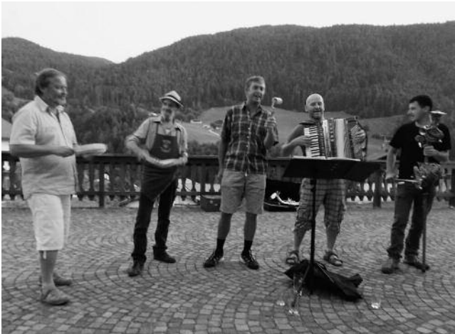
Die 3-Generationenband- Volksmusik bis zum Abwinken.