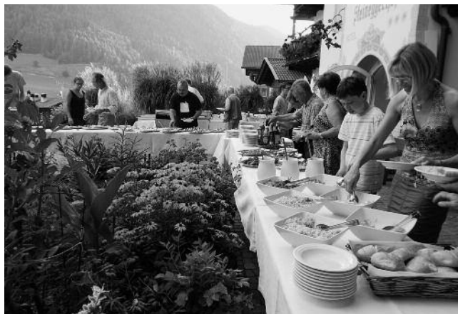
Grillabend im Garten des Steinegger Hofes