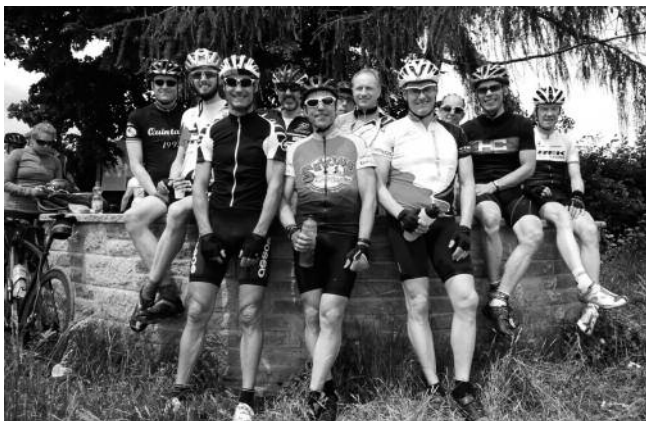
Bei Krapfenreuth, die letzte Verpflegungsstelle