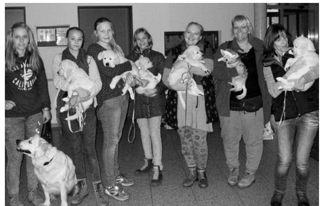
Ankunft der kleinen Hundestaffel

Am Freitag, 19. Dezember 2014 war, wie schon eine Woche zuvor, Therapie-Hunde-Besuch im Altenzentrum angesagt. Die Welpen: Fenja, Nanuk, Kaya, Mia, Paula, Olympia sowie