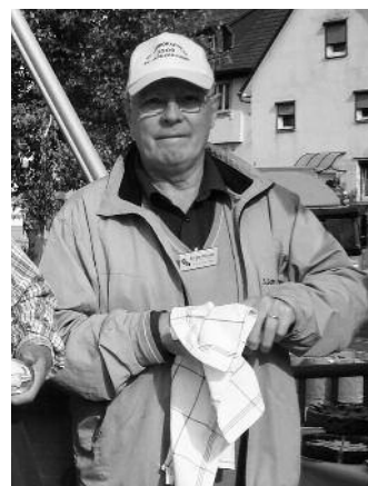
2009 beim Brückenfest

Bei vielen Aktivitäten, wie z.B. dem Brückenfest oder dem Flohmarkt, reihte er sich ins Helferteam ein. Das erfolgreiche Projekt „Sanierung Königsstein“ hat er initiiert und selbst abgewickelt.