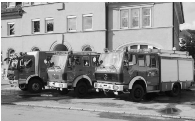
Die Großfahrzeuge der Plüderhäuser Wehr - links neben dem bisherigen Notruf-Nummern-Logo der neue Europa-Aufkleber

Für Plüderhausen läuft die Notrufnummer 112 in der integrierten Rettungsleitstelle Rems-Murr in Waiblingen auf. Diese ist rund um die Uhr von Mitarbeitern des Deutschen Roten Kreuzes besetzt. Die Notrufe werden nach einem strukturierten Frageschema bearbeitet und die nach Einschätzung des Disponenten erforderlichen Hilfskräfte alarmiert. Während die Einsatzkräfte anfahren, kann der Mitarbeiter bei Bedarf Erste-Hilfe-Hinweise an den Anrufer weitergeben.