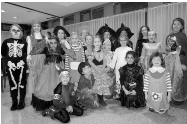
confetti feiert Fasching

Plüderhausen zählt nun wirklich nicht zu einer Faschingshochburg - doch bei unseren Faschingschorproben ist davon nichts zu spüren. Alle Kinder kamen wieder in tollen und fantasievollen Kostümen, waren schön geschminkt und in ausgelassener Stimmung. Wir eröffneten unsere Probe mit einigen Faschingskinderliedern, zwischendurch gab es Spiel-einlagen und auch Faschingskräpfen durften natürlich nicht fehlen. Trotz krankheitsbedingter Abwesenheit der Chorleiterin hat das Singen gut geklappt und die Zeit verging viel zu schnell.