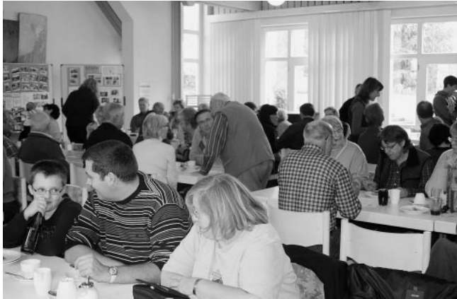
Ein Blick in den gut gefüllten Jakob-Schule-Saal

Am vergangenen Donnerstag fand traditionell das Zwiebelkuchenfest des CVJM im Ev. Gemeindezentrum statt. Dank den zahlreichen Spenden von Kuchen und leckeren Torten, sowie köstlicher Zwiebelkuchen, konnten die zahlreichen Besucher verwöhnt werden.