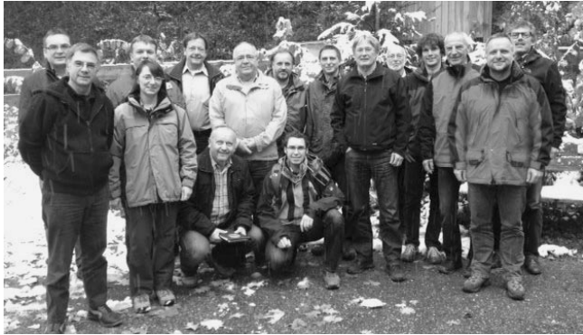
Das Festkomitee der ARGE Plüderhäuser Festtage

Insgesamt wären die Festtage wie immer sehr sauber und friedlich verlaufen, wenn nicht der Festsamstag dieses Jahr einige überraschende Probleme gebracht hätte. Hier ist die ARGE nun dabei, im Bereich des Sicherheitskonzeptes Neuerungen einzuführen. Wie diese aussehen, ist zum jetzigen Zeitpunkt noch nicht klar. Hier gilt es, gemeinsam mit der Polizei, die hier entsprechende Forderungen stellt, einen Konsens zu finden, der beide Seiten zufrieden stellt.