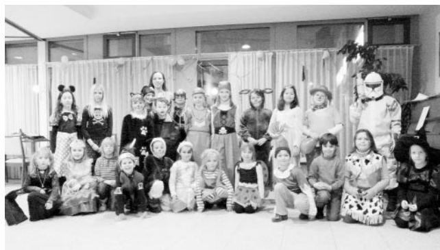
„confetti“ bei der Faschingschorprobe in tollen Verkleidungen

Viele phantasievoll verkleidete und toll geschminkte „confetti“ Kinder trafen am vergangenen Mittwoch zu einer lustigen Faschingschorprobe ein. Die Prinzessinnen, Clowns, Hexen, Indianer, Piraten und andere nette Gestalten hatten bei Musik, Spiel und Tanz sichtlich viel Spaß.