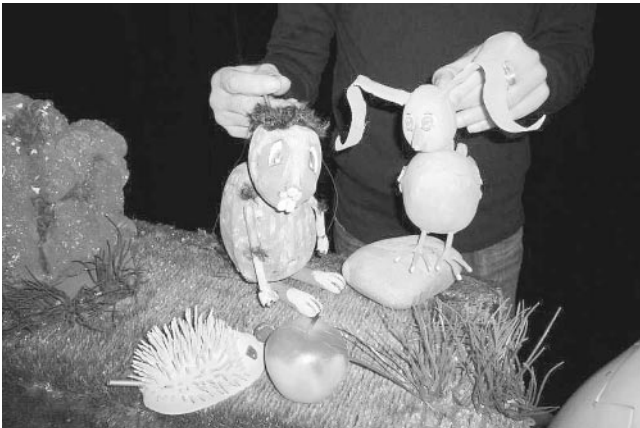
Keinohrhasen und Zweiohrküken

Eine rund herum gelungene Theatervorstellung ging viel zu schnell zu Ende.