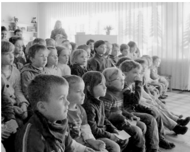
Aufmerksame Zuschauer ...

Eine höchst vergnügliche Theatervorstellung ging viel zu schnell zu Ende.