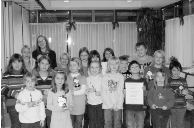
confetti feierte Weihnachten

Nach unserem erfolgreichen Auftritt beim Weihnachtskonzert der Sängervereinigung „Macht hoch die Tür“, hatten wir uns eine Chorprobe mit Spiel und Spaß verdient.