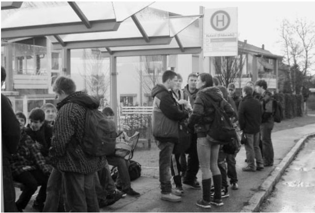
Warten auf den Bus

Auf der Rückfahrt legten wir zur Stärkung noch einen kleinen Zwischenstopp in Cannstatt ein. Als wir gegen 16 Uhr Plüderhausen wieder erreichten, waren sich Alle einig: es war wieder ein toller Tag und ein schönes Erlebnis.