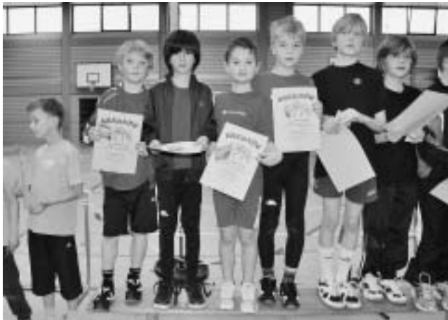
Schüler D Staffelzweite

In der Trainingsgruppe unserer Jüngsten am Donnerstag sind wieder neue Kinder ab 6 Jahren willkommen. Wer Lust am Laufen, Springen und Werfen aber auch an vielfältigen Spielen hat, soll einfach zum Schnuppern vorbeikommen. Weitere Infos auch bei D. Kunzweiler (Tel. 82578)