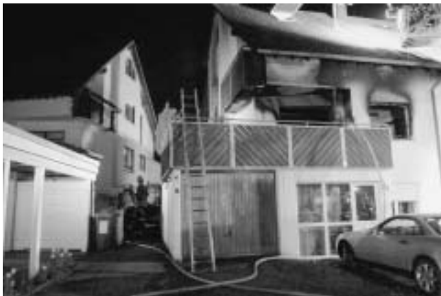
Vollständig ausgebrannte Wohnung im 1. Obergeschoss