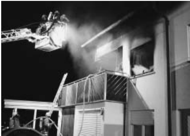
Löscharbeiten vom Korb der Drehleiter Schorndorf aus

Brandausmaß auch nach Beendigung der Löscharbeiten noch regelmäßige Kontrollen der Brandräume notwendig sind.