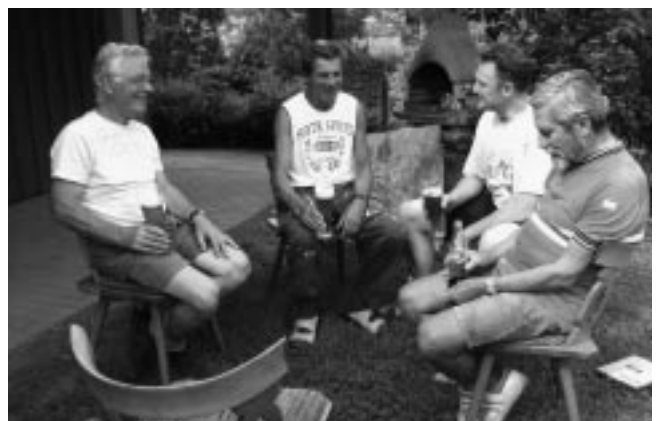
Wer arbeitet soll auch essen und trinken.