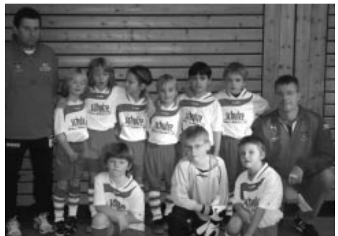
Die Mannschaft präsentiert stolz die neuen Trikots

Beim Hallenturnier das vorletztes Wochenende in der Hohberghalle stattgefunden hat, konnten sich unsere Jungs und Mädels erstmal mit ihren neuen Trikots präsentieren. Die Mannschaft mit ihren Betreuern bedankt sich sehr herzlich bei der Bäckerei Schulze aus Urbach (Filiale Plüderhausen, Gmünder Str. 21) für die großzügige Spende!