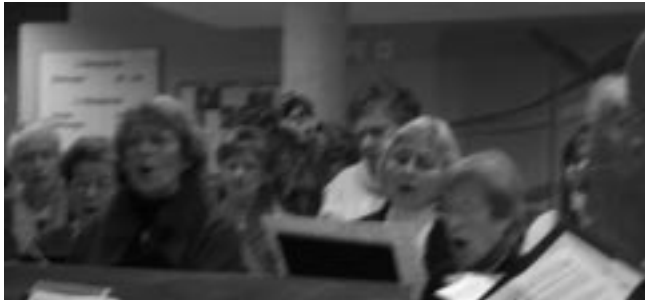
Chorgesang in der Cafeteria

Auftakt war in der Cafeteria des Hauses mit „Die Steppe wird blühen“ gefolgt von den vertonten Gebeten „Herr mach mich zu einem Werkzeug deines Friedens“ und „Vater unser“. Diesem getragenen Beginn folgten verschiedene Kanen wie „Viva la musica“, „Wann und wo“, „Froh zu sein bedarf es wenig“ und „Abendstille überall“. Anschließend begab sich der Chor zu weiteren musikalischen Darbietungen auf die jeweiligen Stockwerke um dort ebenfalls die Heimbewohner zu erfreuen, denen es nicht möglich war die Cafeteria zu besuchen. An dieser Stelle nochmals herzlichen Dank allen Sängerinnen und Sängern.