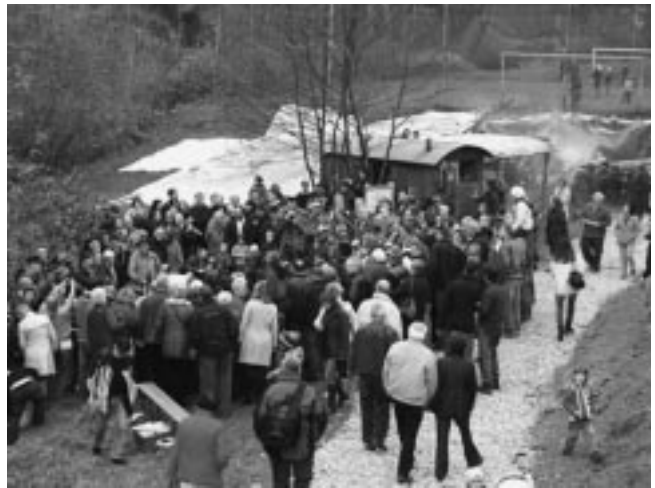
Viele interessierte Zuschauer fanden sich zur ersten Glasschmelze seit Jahrhunderten in Walkersbach ein.