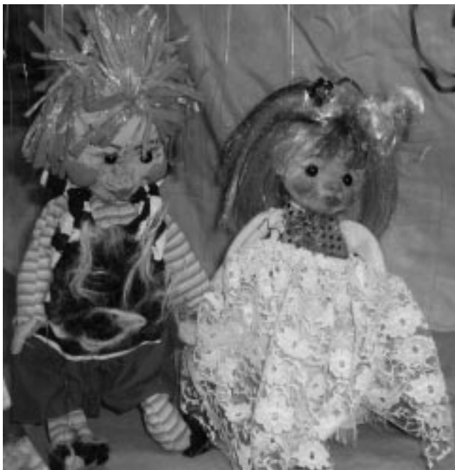
Zausel und Pompom

den Buchregalen. Nach der Vorstellung waren die Kinder eingeladen die Marionetten aus der Nähe anzuschauen und auch ein Blick hinter die Bühne war erlaubt.