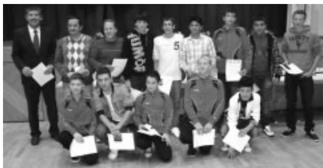
C-Jugend Meister der Kreisstaffel