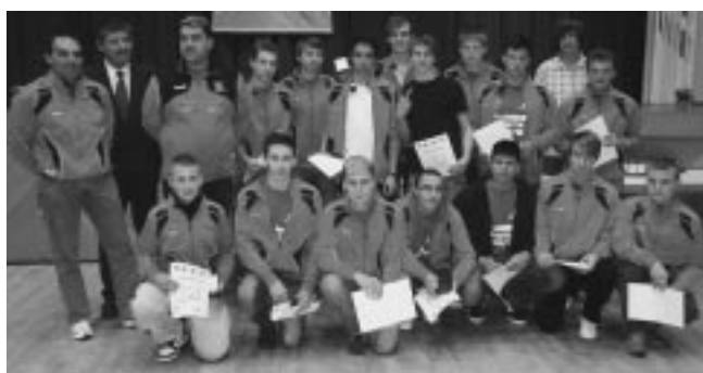
B-Jugend Meister der Kreisstaffel