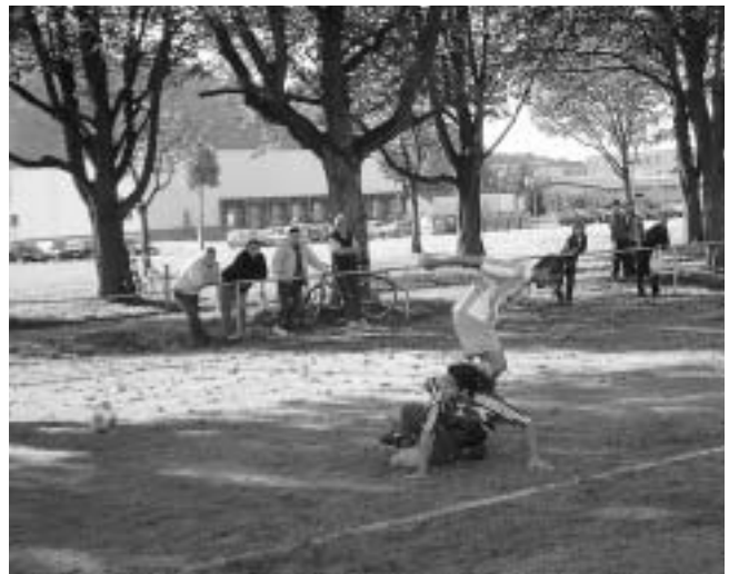
Der SVP momentan am Boden