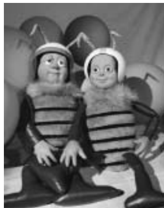
Willi und Maja...

Die Gemeindebücherei und die örtlichen Kindergärten haben sich in diesem Jahr für „Biene Maja“ entschieden, gespielt vom Figurentheater „marotte“ aus Karlsruhe.