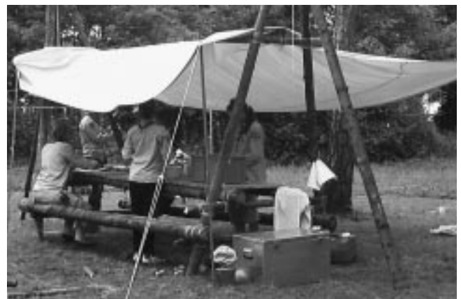
Ein kleiner Eindruck vom Campleben auf unserem Sommercamp.

Über Besucher und NEUE Interessierte freuen wir uns, kommt doch einfach mal vorbei und macht mit.