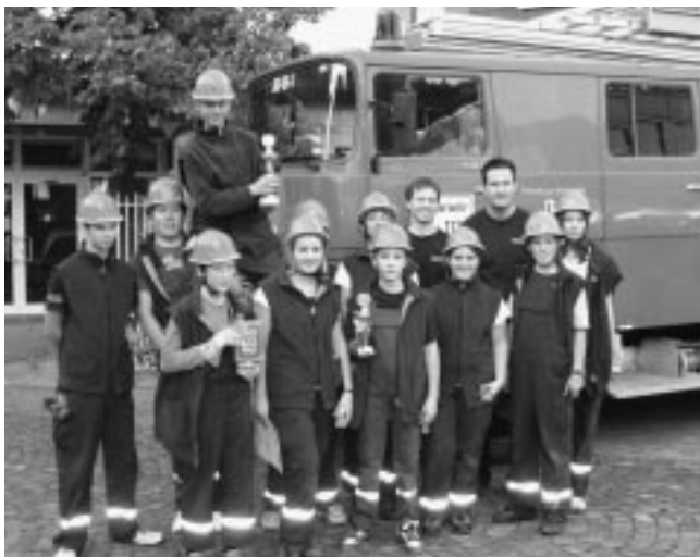
Die Gruppen mit Betreuer nach der Siegerehrung in Lorch.

Jugendfeuerwehr mit einem Präsent bei den Lorcher Kameraden für die sehr gute Zusammenarbeit der letzten Jahre.