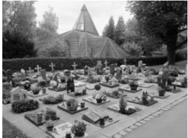
Im mittlerweile drei Jahre alten Erdurnenfeld 1 gibt es noch keine Setzungen, so dass sich die Mehrheit des Gemeinderats nichts von einem Versuch mit Splitt im neuen Erdurnenfeld 8 versprach.

Nach längerer Diskussion wurde der Antrag von GR Angelmahr, die Verwaltung solle für Feld 8 einen Vorschlag zur Grabeinfassung als Alternative zur bisherigen Platten-einfassung erarbeiten mit 7 Ja-Stimmen, 9 Nein-Stimmen und 1 Enthaltung abgelehnt.