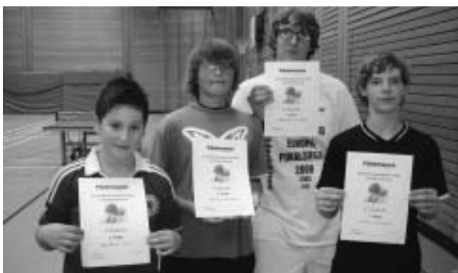
Nr. 45 Tischtennisturnier, Veranstalter: Gemeinde Plüderhausen