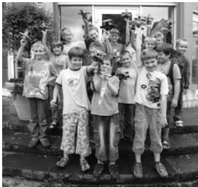
Nr.64 Wir erkunden eine Streuobstwiese, Veranstalter: Landratsamt Rems-Murr-Kreis

Das EnBW-Regionalzentrum Alb-Neckar mit Sitz in Kirchheim bringt sich damit im Jahr 2010 am Sommerferienprogramm von insgesamt 46 Kommunen der Region aktiv ein. Die Modelle der Flugzeuge und Hubschrauber wurden für diesen Anlass von der „Schwarzwald-Werkstatt“ - Werkstätten und Wohnheime für behinderte Menschen GmbH - angefertigt.