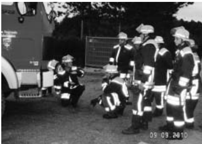
Unterweisung zum Anheben eines Fahrzeugs mit druckluftbetriebenen Hebekissen.