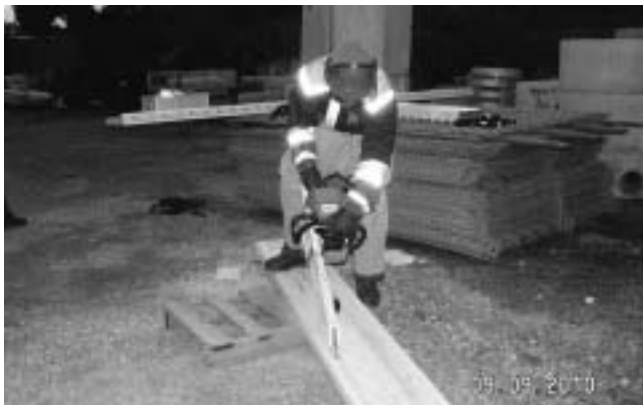
Einsatz der Rettungssäge beim Auftrennen einer Dachhaut.

Die Aufgaben der Freiwilligen Feuerwehr Plüderhausen sind vielfältig. Schon lange steht nicht mehr nur die Bekämpfung von Bränden im Vordergrund. Die technische Hilfeleistung ist in den letzten Jahrzehnten immer wichtiger geworden. Deshalb fand am vergangenen Donnerstag auf dem Lagerplatz des Gemeindebauhofs am Uferweg eine Ausbildung zur technischen Hilfeleistung statt. Aufgeteilt in fünf Gruppen mussten die Stationen Einsatz eines Trennschleifers, Arbeiten mit der Rettungssäge, der Einsatz von druckluftbetriebenen Hebekissen, der Umgang mit den hydraulischen Rettungsgeräten Schere und Spreizer und die Verwendung eines Greifzuges durchlaufen werden. Diese zum Teil mit dem neuen Löschgruppenfahrzeug LF10/6 neu beschafften Gerätschaften (Hebekissen, Rettungssäge) konnten an dieser Übung realitätsnah eingesetzt werden und erweitern sinnvoll die Ausrüstung der Feuerwehr Plüderhausen im Bereich technische Hilfe.