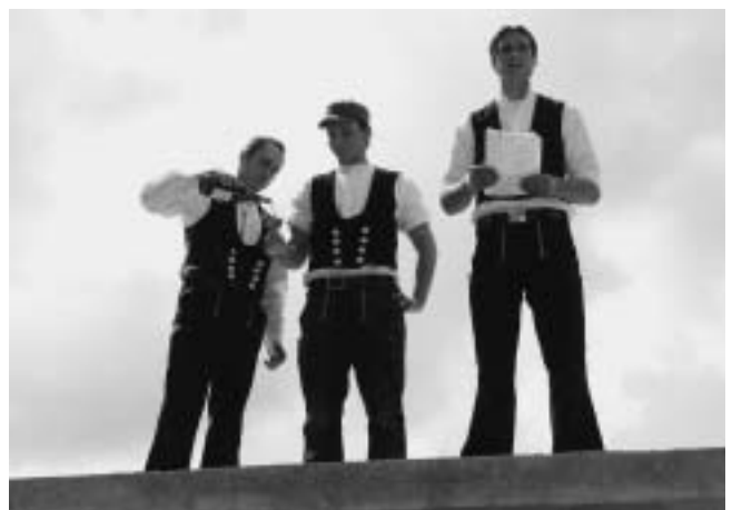
„Nun reicht den Becher Wein mir her, auf's Wohl des Hauses ich ihn leer. Ich will damit den Segen geben, dem Neubauer hier und denen, die darin Leben.“

„Nun fahre hin Du Glas zum Grunde. Geweiht sei Mensa und Sporthalle zur Stunde!“ Der Richtspruch der Zimmerleute vergangenen Freitag läutete pünktlich zur Hälfte der 18-monatigen Bauzeit das Ende der Rohbauarbeiten des Großbauprojekts am Hohbergschulzentrum ein.