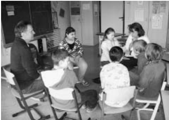
Vorlesegruppe des Seniorennetzwerks

Dieser solle sich z.B. mit Problemen bezüglich Barrierefreiheit im öffentlichen Raum befassen.