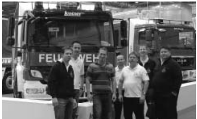
Die Gruppe vor dem Plüderhäuser Fahrzeug

Eine Gruppe der Plüderhäuser Feuerwehr hat es sich nicht nehmen lassen und ist nach Leipzig gefahren um diese internationale Fachmesse und natürlich auch den Stand der Firma Lentner mit unserem Fahrzeug zu besuchen. Mittlerweile ist das Fahrzeug wieder wohlbehalten zurück in Plüderhausen.