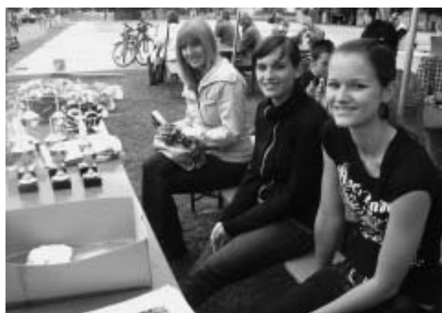
Unsere Ehrungsmädchen gestalten wieder auf die Siegerehrungen mit.

Am Start und Ziel gibt es reichlich Verpflegung: Fassbier, sonstige Getränke, Maultaschen, Rote Würste, Currywürste, Pommes und genügend Sitzgelegenheiten, um das lautsprecherkommentierte Rennengeschehen auch mit Siegerehrungen in allernächster Nähe verfolgen zu können. Zuschauer bezahlen keinen Eintritt.