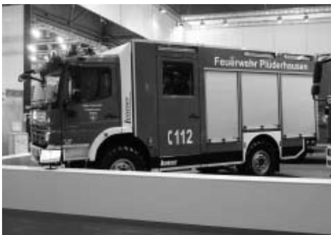
Das LF 10/6 auf dem Messestand der Firma Lentner