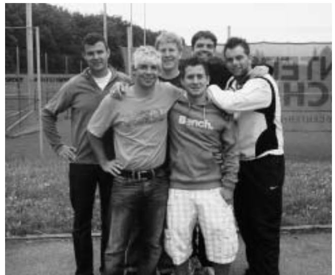
Herren 1 Mannschaft nach dem überzeugenden Auswärtserfolg in Mutlangen !!!

Allen Mannschaften die am 3. Spieltag im Einsatz sind viel Erfolg.