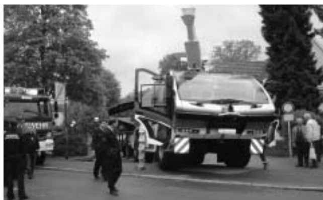
Eine Seltenheit auf der Straße: Flugfeldlöschfahrzeug der Fa. Lentner