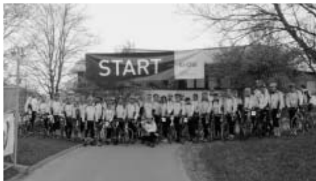
Die größte Gruppe war wieder die Diakonie, und trotz des Sturzes eines ihrer Radler waren sie alle total begeistert

Mit Bildern lässt sich das dynamische Geschehen am besten veranschaulichen: