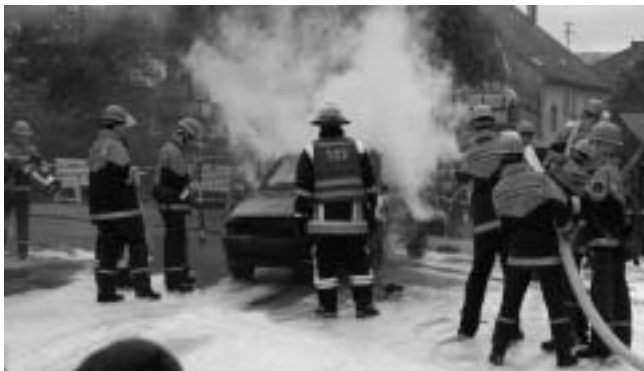
Schauübung der Jugendfeuerwehr