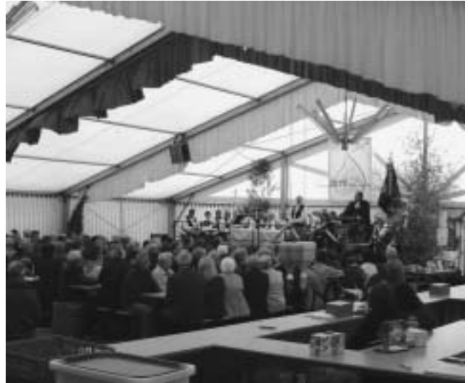
Ökumenischer Gottesdienst im Festzelt