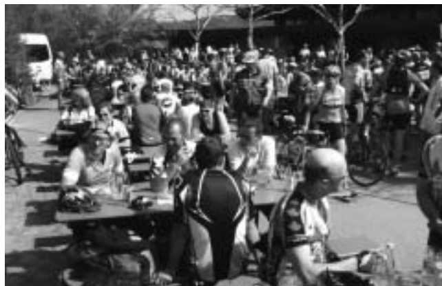
Das große Hock-Happening um die Sporthalle. Viele fanden keinen Platz mehr an den Tischen.