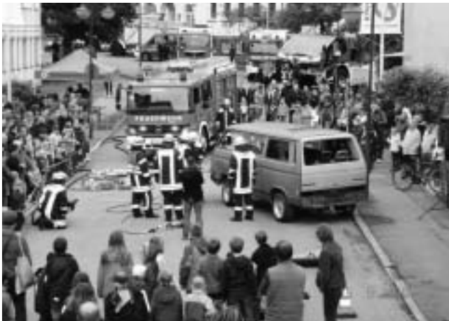
Vorführung Technische Hilfeleistung der Feuerwehr Lorch

Wir laden herzlich ein zum Bibelabend am Mittwoch, 26.5., um 20.00 Uhr im Gemeindezentrum Wittumhof, Hiller-Saal.