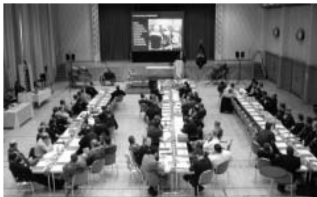
Fachveranstaltung in der Staufenhalle

Das Festbuch zum Jubiläum ist für jedermann kostenlos in der Buchhandlung Donner erhältlich. Nutzen Sie die Gelegenheit und sichern Sie sich Ihr persönliches Exemplar!