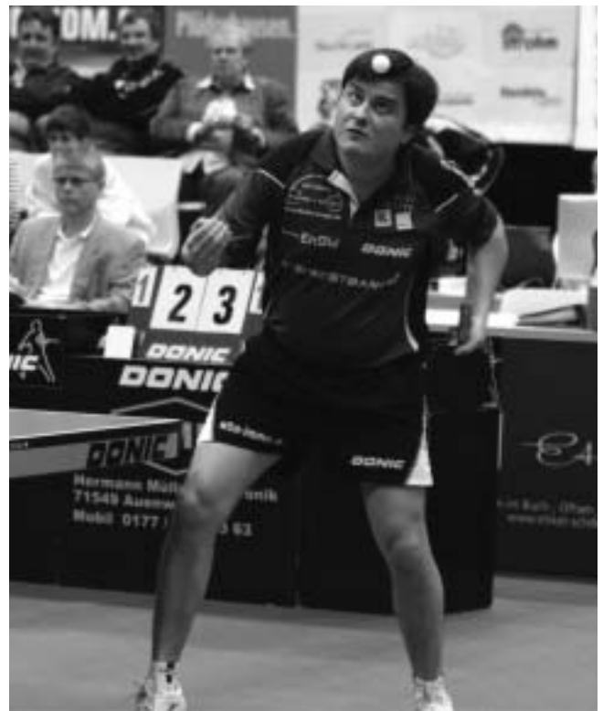
Auch in der neuen Saison weiter beim SVP: „Unser Kara“

können und es wird wieder eine spannende Runde mit hervorragendem Tischtennis in unserer Hohberg-Sporthalle werden.