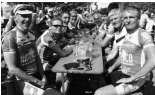
Eine zufrieden, fröhliche Radlergruppe, typisch für unsere Kundschaft an diesem sonnigen Tag.