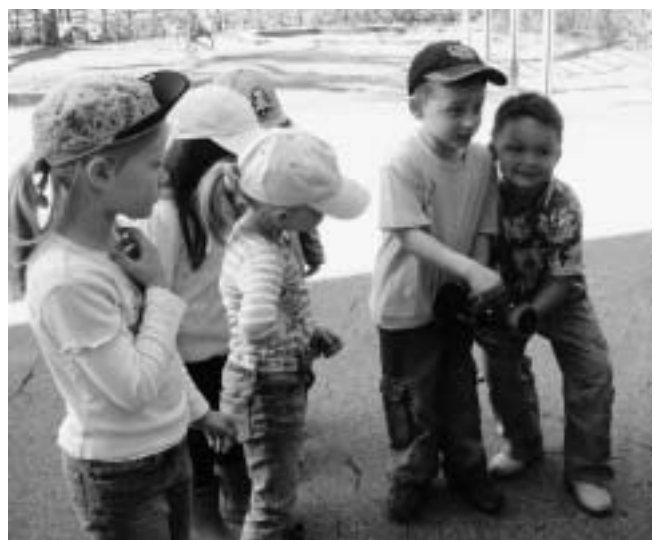
„Da kommt das Wasser dann raus!“