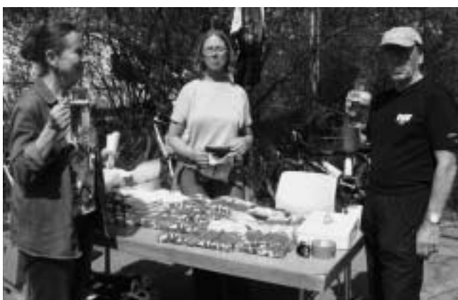
Unser Souvenirladen: Radtrikots, T-Shirts, Radhandschuhe und die ersten von ihrem Außenposten zurückgekehrten Helfer.