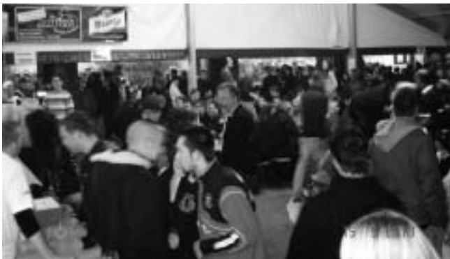
Gut besuchtes Fest am Samstagabend