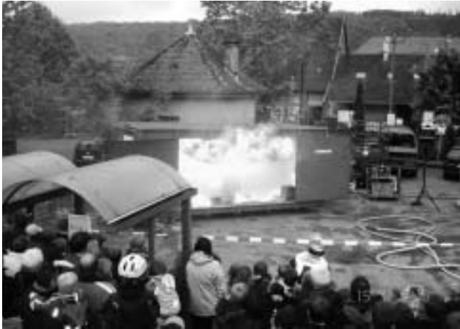
Fettbrandexplosion in Übungscontainer der Feuerwehr Plüderhausen