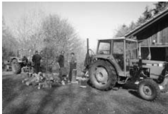
Bei der Spaltarbeit

Bereits am Freitag-Nachmittag 23. April wurde mit dem Zersägen der Stämme im Wald begonnen. Die zahlreichen Helfer konnten am Samstag die auf 30 cm Länge gesägten Stücke mit zwei Holzspalter aufspalten. Das Wetter spielte perfekt mit.