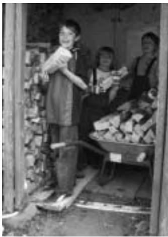
Hoffnungsvoller Nachwuchs im Einsatz

30 fleißige Hände haben dazu beigetragen, dass nun insgesamt 11 Festmeter ofenfertiges Holz sich in den Holzhütten befinden, der nächste Winter kommt bestimmt.