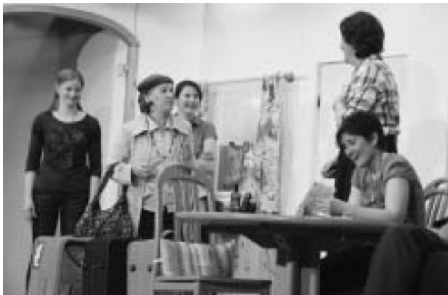
Die Kitzbüheler Heimatbühne voll in Aktion bei ihrer Komödie „Ein Sack voller Flöhe“

Telefon: 07181-87222, per E-Mail: info@theaterbrettle.de. Besuchen Sie uns auch im Internet: www.theaterbrettle.de