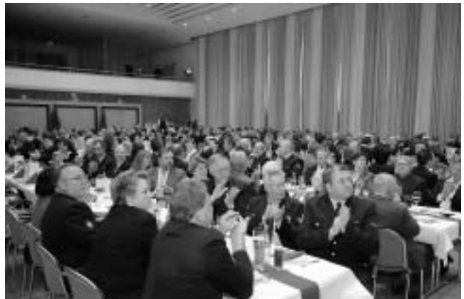
Die gut gefüllte Staufenhalle