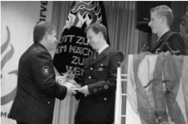
Dank an Herrn Dominik Göltz für die grafische Erstellung des Jubiläumsbuches