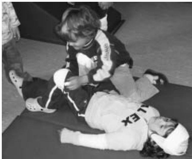
1. Helfer Kasimir eilt zu Hilfe !