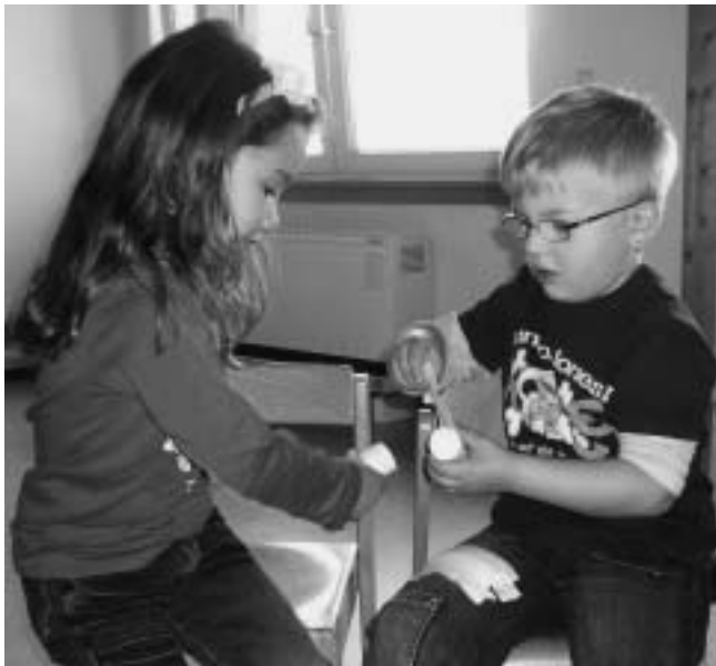
Früh übt sich !

Die Kinder und Erzieher vom Kindergarten Drosselweg