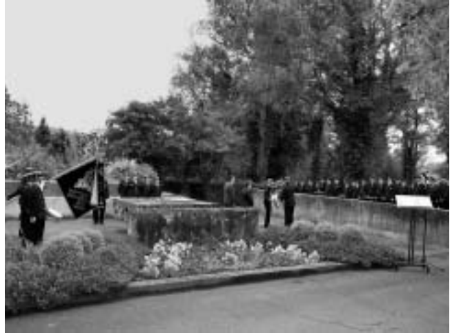
Kranzniederlegung am Ehrenmal des Plüderhäuser Friedhofs

Den Abschluss des nicht mit vielen Reden, sondern durchaus kurzweiligen und unterhaltsamen Programmes bildete eine bayerische Comedy. Anschließend spielte die Band El Dorados zum Tanz.