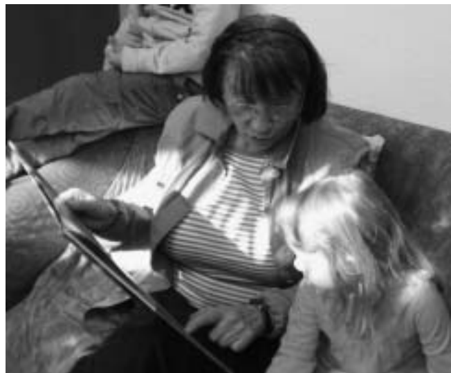
Bücher eröffnen den Kindern die Welt !