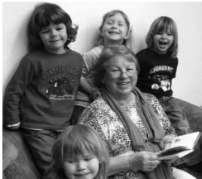
Vorlesen macht allen Spaß !

Die Kinder und Erzieherinnen vom Kindergarten Drosselweg