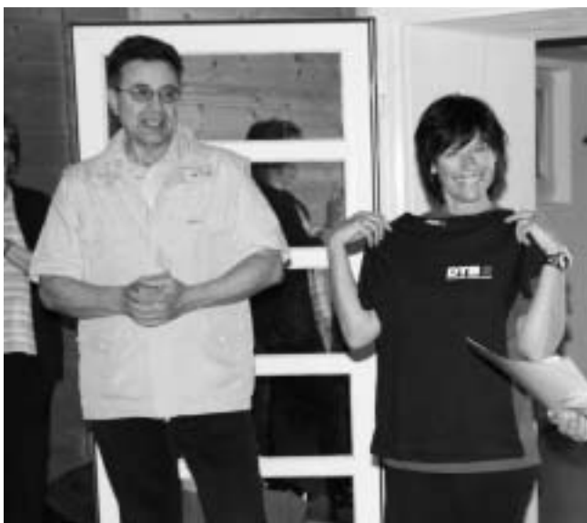
Übergabe des T-Shirts PLUSPUNKT GESUNDHEIT an die Übungsleiterin

Gesundheitssport ist im letzten Jahrzehnt zu einem bedeutenden Sektor im Vereinssport herangewachsen. Als erste Sportorganisation hat der DTB bereits 1994 das Qualitäts-