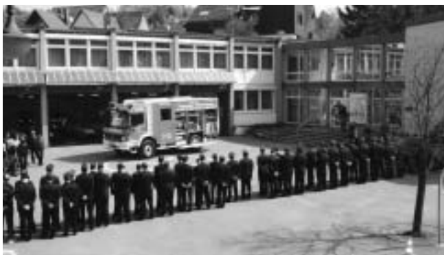
Die angetretene Mannschaft bei der Übergabe