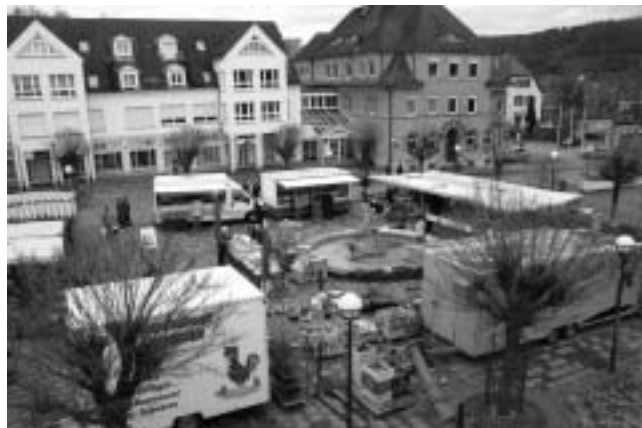
Der Plüderhäuser Wochenmarkt am Samstag

Ein weiterer Bestandteil des Marktes ist der „Treff am Wochenmarkt“. Hier können sich alle Plüderhäuser Vereine, Kirchen und sonstige Organisationen sowie Kindergärten und Schulklassen präsentieren. Meist wird selbst Gebackenes oder Gebasteltes zur Finanzierung einer Gruppenveranstaltung oder für einen guten Zweck verkauft. Bei Interesse an unserem Wochenmarkt teilzunehmen oder einen „Treff am Wochenmarkt“ auszurichten wenden Sie sich bitte an Herrn Tilmann Kropf unter der Telefonnummer 07181/8009-33 oder der E-Mail-Adresse t.kropf@pluederhausen.de.