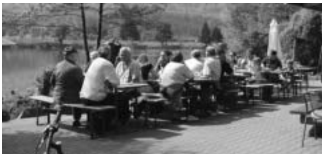
Maihock - genießen auf der Terrasse

Der 1.Mai naht und die Vorbereitungen zum Maihock am Badesee sind im vollen Gange. Wir werden unsere Gäste wieder mit unseren bekannten Spezialitäten wie geräucherte und gegrillte Forellen, Heringsbrötchen, Göckele und Würste vom Grill verwöhnen. Für die Frühwanderer unter unseren Gästen, haben wir uns etwas Besonderes ausgedacht. Es gibt von 10:00 Uhr bis 12:00 Uhr ein deftiges Weißwurstfrühstück. Alles das können unsere Gäste wie gewohnt bei schönem Wetter auf unsere Terrasse am Badesee genießen. Wir freuen uns auf alle treuen und neuen Besucher, die wir am 1. Mai in unserem Vereinsheim am Badesee begrüßen dürfen.