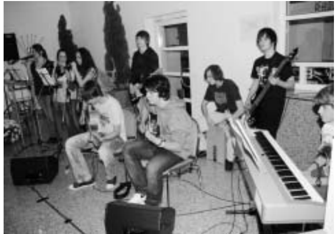
Begeisterten die Zuhörer: die Realschul-Band