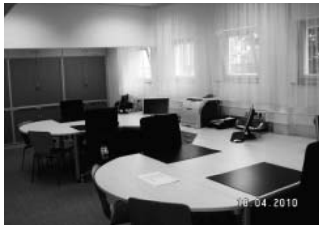
Das neue Dienstzimmer (ehemaliges Fraktionszimmer des Gemeinderats)