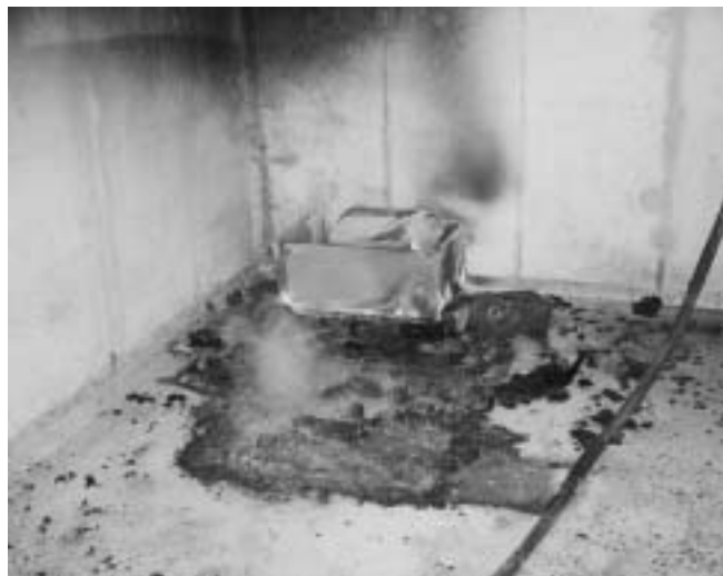
Der erste Brandherd