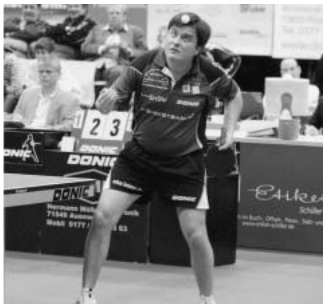
„Kara“ zeigte in seinem letzten Match für den SVP bis zu seiner Verletzung nochmals sein spektakuläres Tischtennis