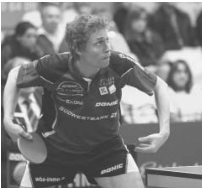
Der 5-fache Weltmeister Jörgen Persson gewann zum Abschluss nochmals alle seine 4 Spiele

Die Mannschaft und die Führungscrew des SVP bedankt sich zum Saisonschluß ganz herzlich bei allen TT-Freunden, die uns auch in dieser Saison mit ihrem Kommen unterstützt haben und hofft, dass alle auch in der nächsten Saison wieder dabei sein werden. Ebenso gilt der Dank natürlich den vielen Helfern, unseren Sponsoren und dem Freundeskreis, die dafür sorgen, dass wir auch in der neuen Saison wieder in der 1. Bundesliga (DTTL) starten können.