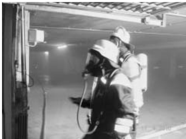
Einsatzkräfte beim Absuchen der Tiefgarage nach weiteren möglichen Brandherden.

Als das erste Fahrzeug bereits wenige Minuten nach der Alarmierung an der Einsatzstelle eingetroffen war, drang dichter Rauch aus einer Tiefgarage. Unter schwerem Atemschutz begaben sich umgehend 2 Trupps ins Gebäudeinnere. Diese konnten dank dem Einsatz der Wärmebildkamera schnell den Brandherd lokalisieren. In einer schwer