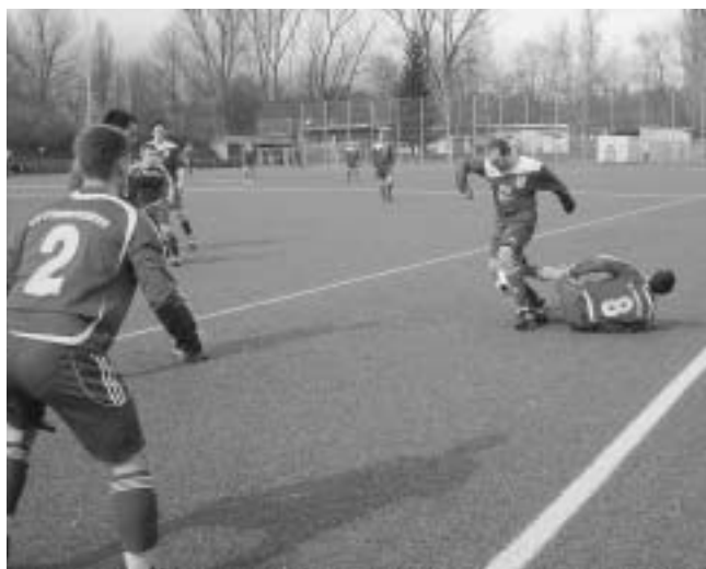
Zrinski Wabilingen war wie im Bild auch am Ende oben auf