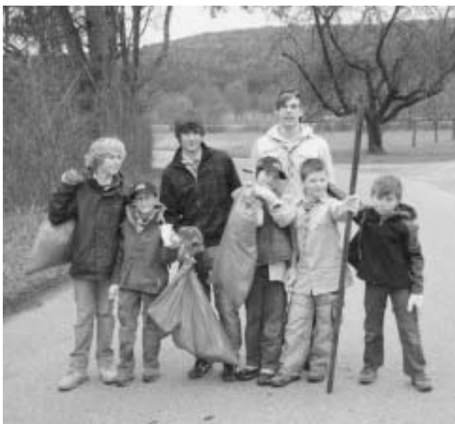
Unterwegs in Feld und Flur