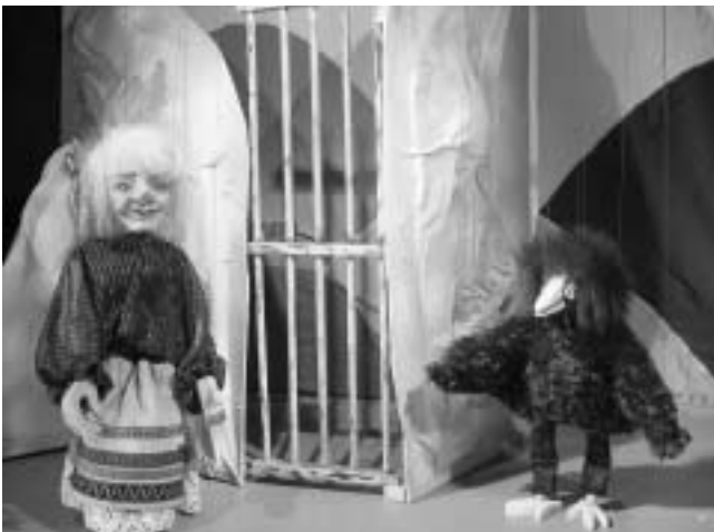
Die Hexe und der Rabe Rudi...

Dies war die letzte Kinderveranstaltung im ersten Halbjahr - im September geht es dann wieder weiter mit Hexen, Raben, Zauberern und Co.