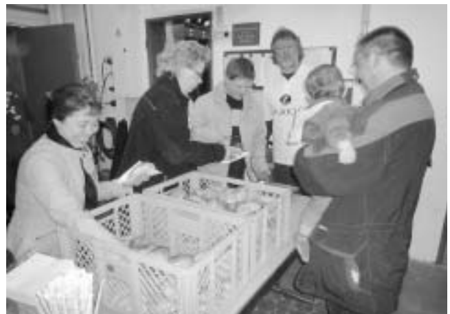
Verpflegung durch den HGV