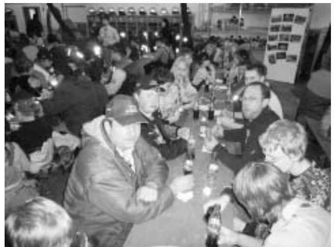
Beim wohlverdienten Vesper