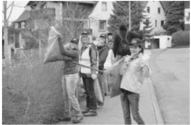
Sauber macht Spaß

Der Lohn dieser aktiven Mithilfe für ein sauberes Plüderhausen ließ nicht lange auf sich warten. Gleich nach getaner Arbeit erhielten alle Helfer, darunter erfreulich viele Kinder und Jugendliche, ein vom Handels- und Gewerbeverein gesponsertes Vesper in Form eines leckeren Schnitzelweckens mit Getränken. Dabei hatte es sich der HGV auch nicht nehmen lassen, die freiwilligen Putzer gemeinsam mit der Jugendfeuerwehr zu bewirten.