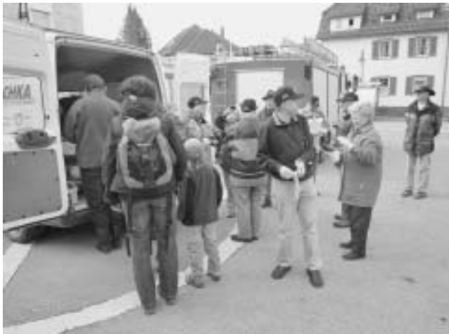
Ausgabe der Arbeitskleidung