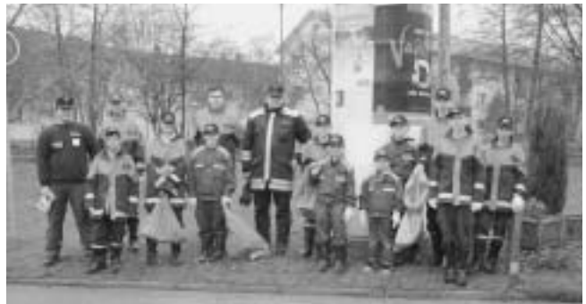
Die Jugendfeuerwehr im Einsatz